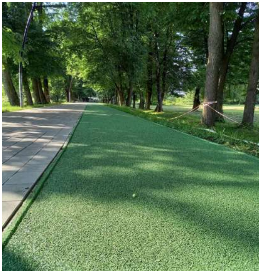
Бігова доріжка з поліуретановим покриттям на міському озері