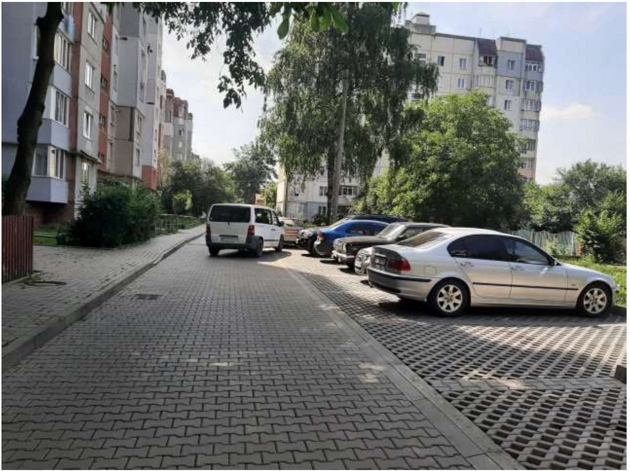
Міжбудинковий проїзд на вул. Івана Павла II, 19