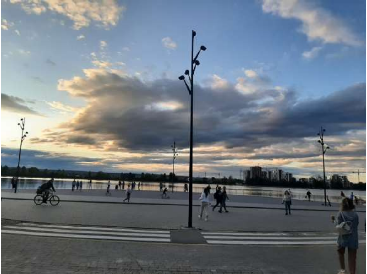
Центральний пірс на міському озері після проведення капремонту

2) влаштування огородження та інших елементів благоустрою на оглядових площадках міського озера на вул. Гетьмана Мазепи в м. Івано-Франківську;