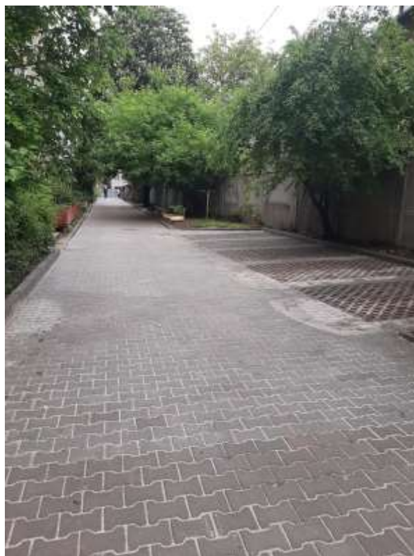
Відремонтований міжбудинкових проїзд Довга, 26-Берегова, 1