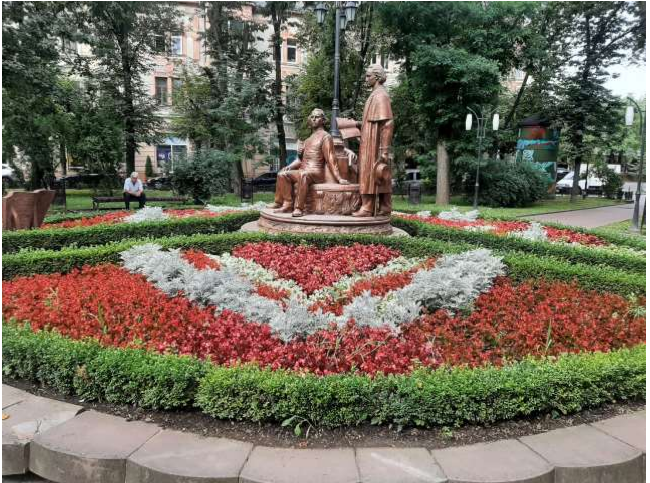
Клумба в центральній частині міста біля пам'ятника Руській трійці

На території міста Івано-Франківськ протягом 2021 року проводилась посадка багаторічних, вічнозелених та літніх квітів на квітниках загальною площею 1054 м 2 .