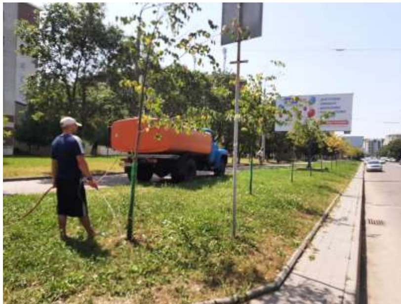
Полив молодих дерев

З метою виконання даних робіт проводились всі необхідні заходи по догляду за молодими деревами, саджанцями, а саме: формування крон молодих дерев, підживлення молодих дерев, полив дерев та саджанців та ін..