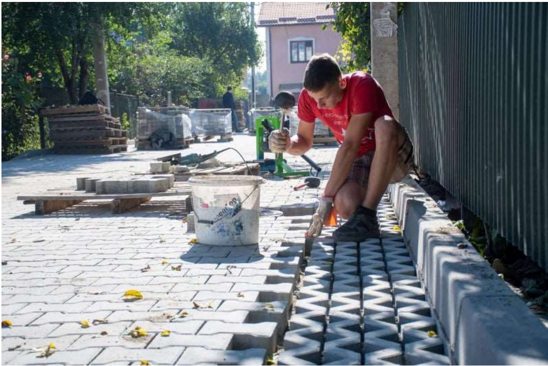
вул. Кобринської в Івано-Франківську

В селах Івано-Франківської міської територіальної громади проведено роботи з влаштування дорожнього покриття на таких об'єктах: