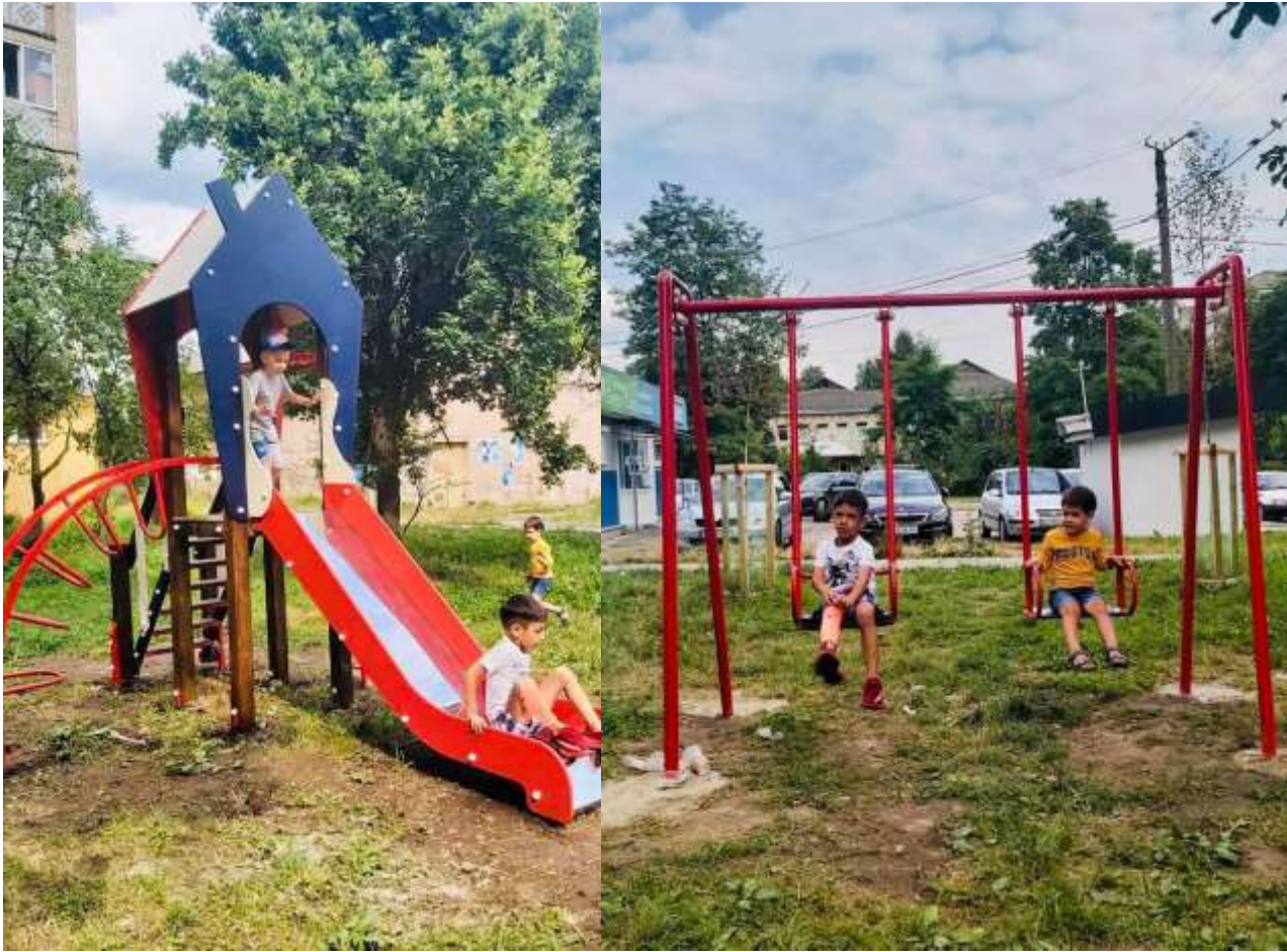
Дитячий майданчик на вул. Вовчинецька, 19