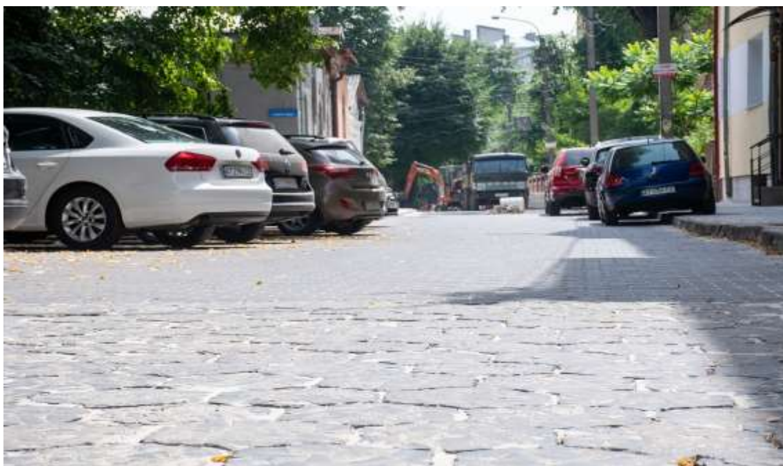
вул. Донцова після капремонту

Зокрема, на території міста Івано-Франківськ здійснено капітальний ремонт вулиці Донцова та вулиці Марка Черемшини; проїзду від вул. Василюшина до вул. Весняна Південна; проїзду від вул. Січинського до вул. Весняна; дорожнього покриття вул. Кобринської та Стефаника (на ділянці від вул. Відкритої до буд. № 31 на вул. Стефаника), вул. Василя Стуса (від буд. № 13 А до буд. № 15 а). Тривають роботи із капітального ремонту вулиць Ленкавського, Котляревського та Теодора Цюклера.