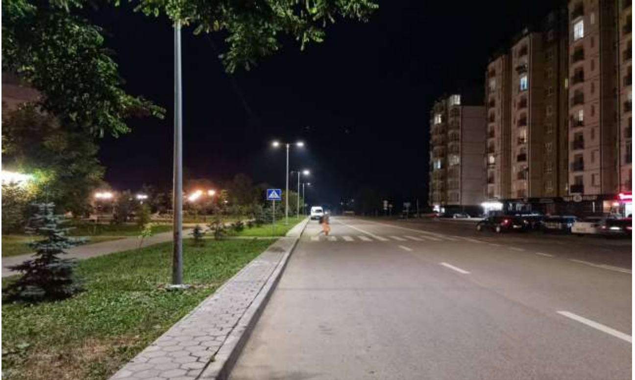
Освітлення вул. Стуса (від вул. Миколайчука до вул. 24 Серпня)

З метою підвищення рівня безпеки систем життєзабезпечення міста та створення умов для безпечного руху автотранспорту та пішоходів упродовж 2021 року проведено роботи із капітального ремонту освітлення вул. Стуса (від вул. Миколайчука до вул. 24 Серпня) та вул. 24 Серпня в м. Івано-Франківську.