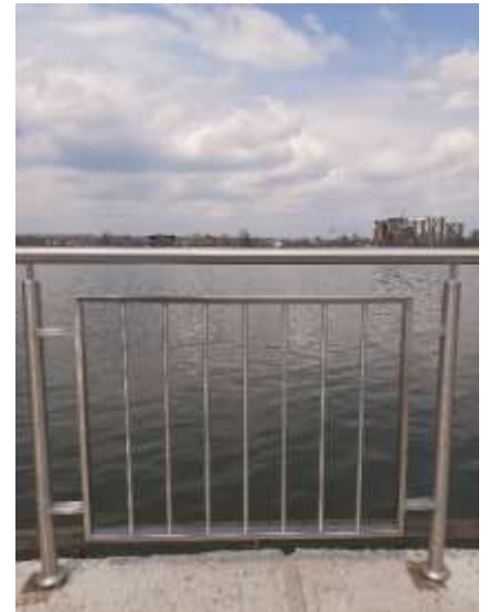
Огородження на центральному та малих пірсах

3) влаштування поліуретанового покриття бігової доріжки навколо міського озера;