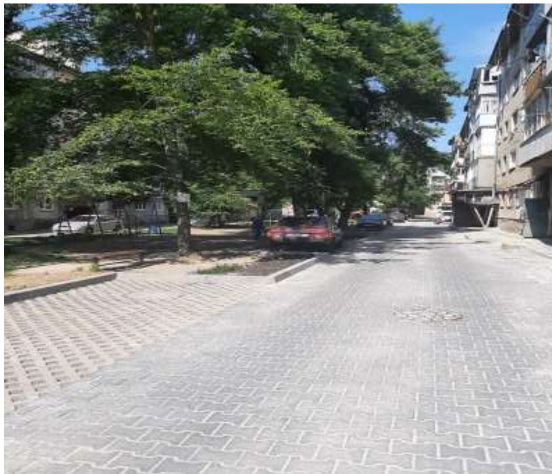
Двір на вул. Сорохтея, 16 після капітального ремонту