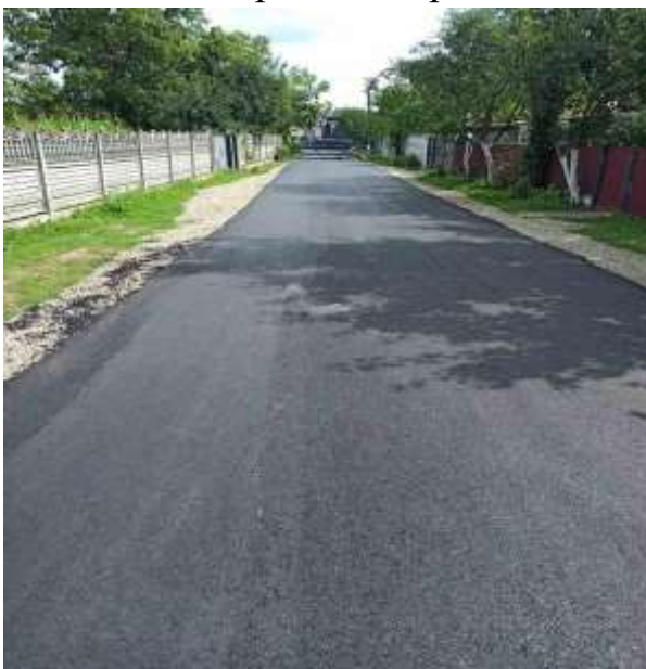
вул. Стефініна в с. Чернів