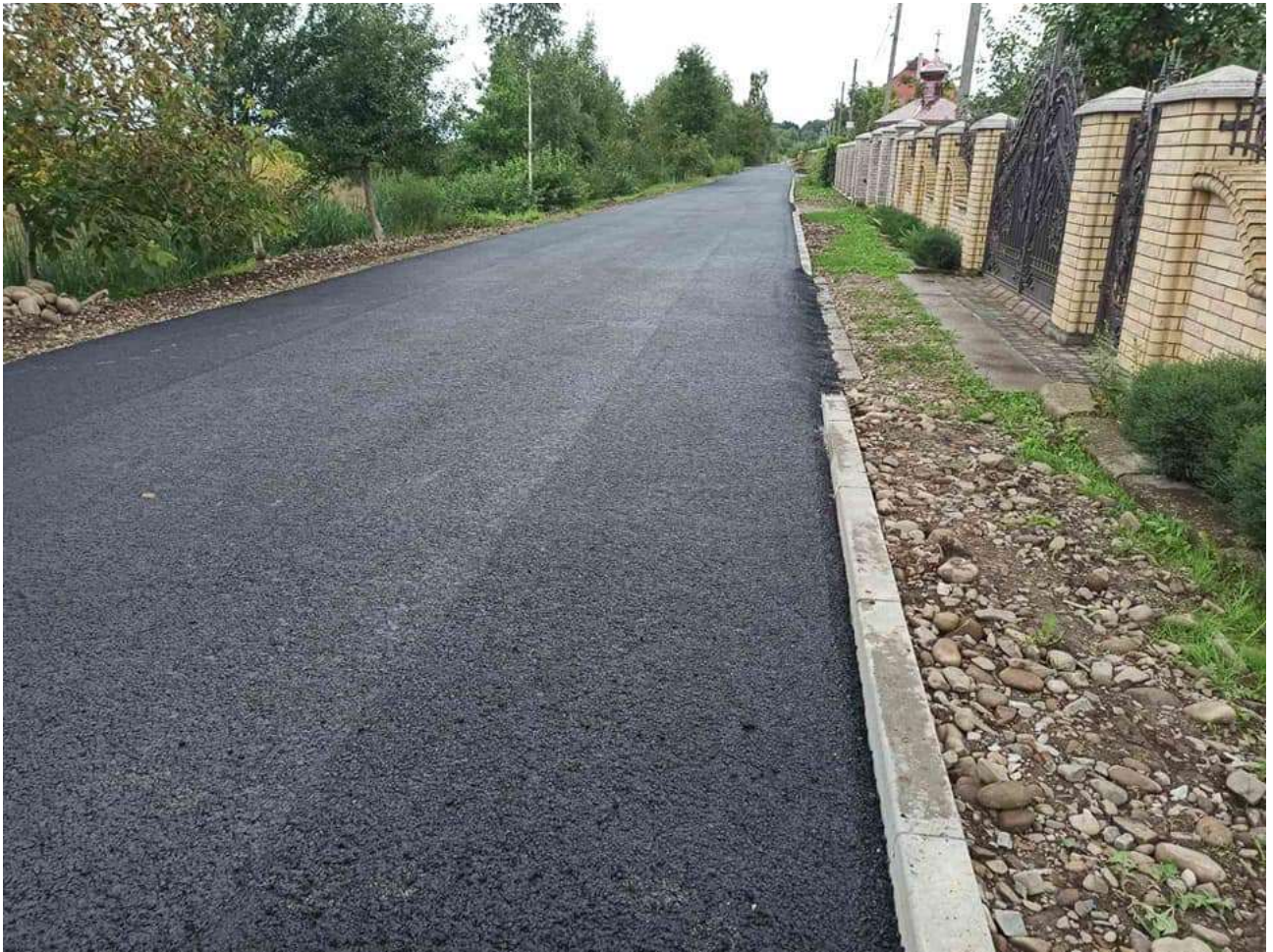
вулиця Степана Бандери в с. Драгомирчани

- Капітальний ремонт дорожнього покриття вул. Степана Бандери.