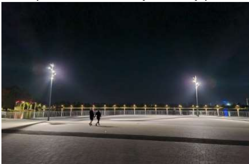
Нове освітлення центрального пірсу на міському озері

Також проведено роботи з ремонту каплиці та благоустрою зеленої зони біля міського озера на вул. Мазепи в м. Івано-Франківську.