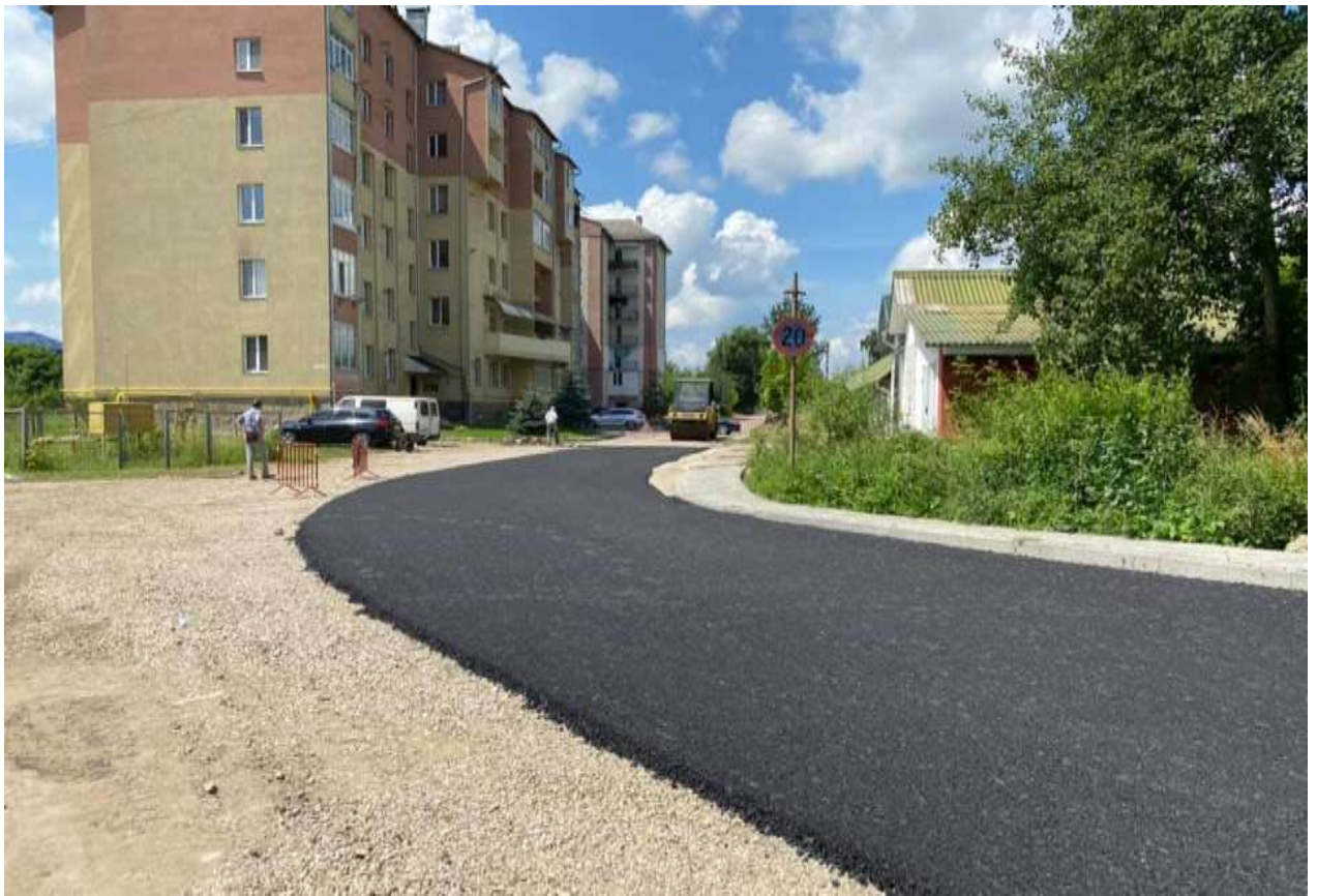
Капітальний ремонт тротуарів та верхнього покриття проїзду від вул. Дудаєва до житлових будинків 30-а, 30-б та промислових об'єктів

Також у 2021 році продовжено та завершено роботи з капітального ремонту міжбудинкових проїздів та прибудинкових територій на вул. Миколайчука, 20А, 22-26 - Симоненка, 26-28-30.