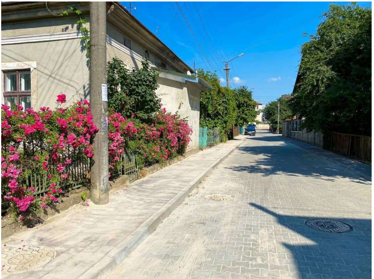
Капітальний ремонт тротуарів і верхнього покриття проїжджої частини вул. Стефаника