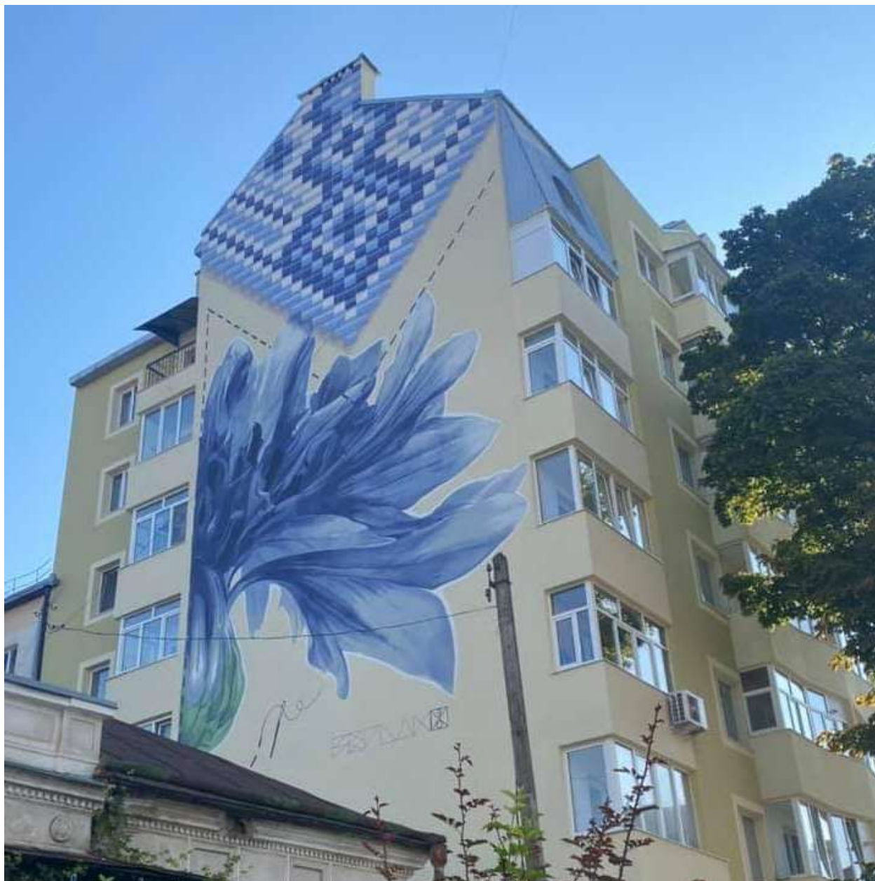
Мурал на вул. Гаркуші, 19 (ОСББ «Гердан»)

Окрім того, розпочато та ведуться роботи ще на семи об'єктах.