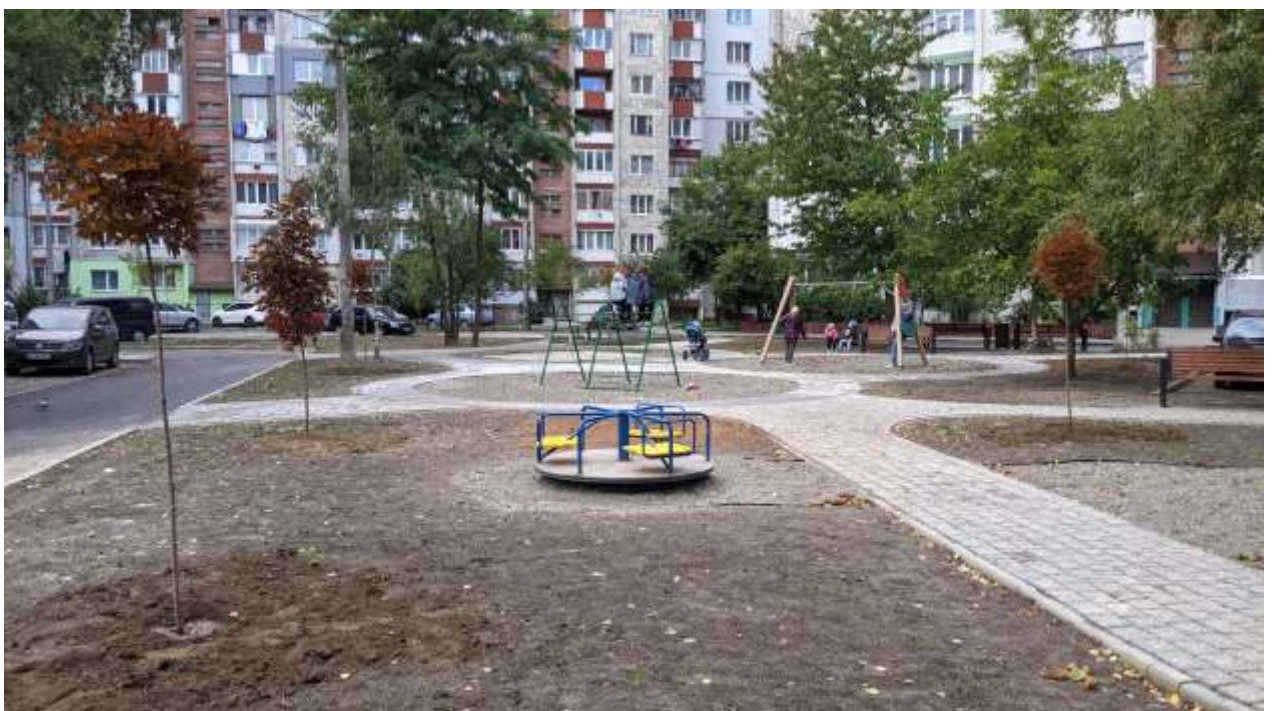
Капітальний ремонт міжбудинкових проїздів та прибудинкових територій на вул. Миколайчука, 20А, 22-26 - Симоненка, 26-28-30

Також у 2021 році продовжено та завершено роботи з капітального ремонту міжбудинкових проїздів та прибудинкових територій на вул. Миколайчука, 20А, 22-26 - Симоненка, 26-28-30.