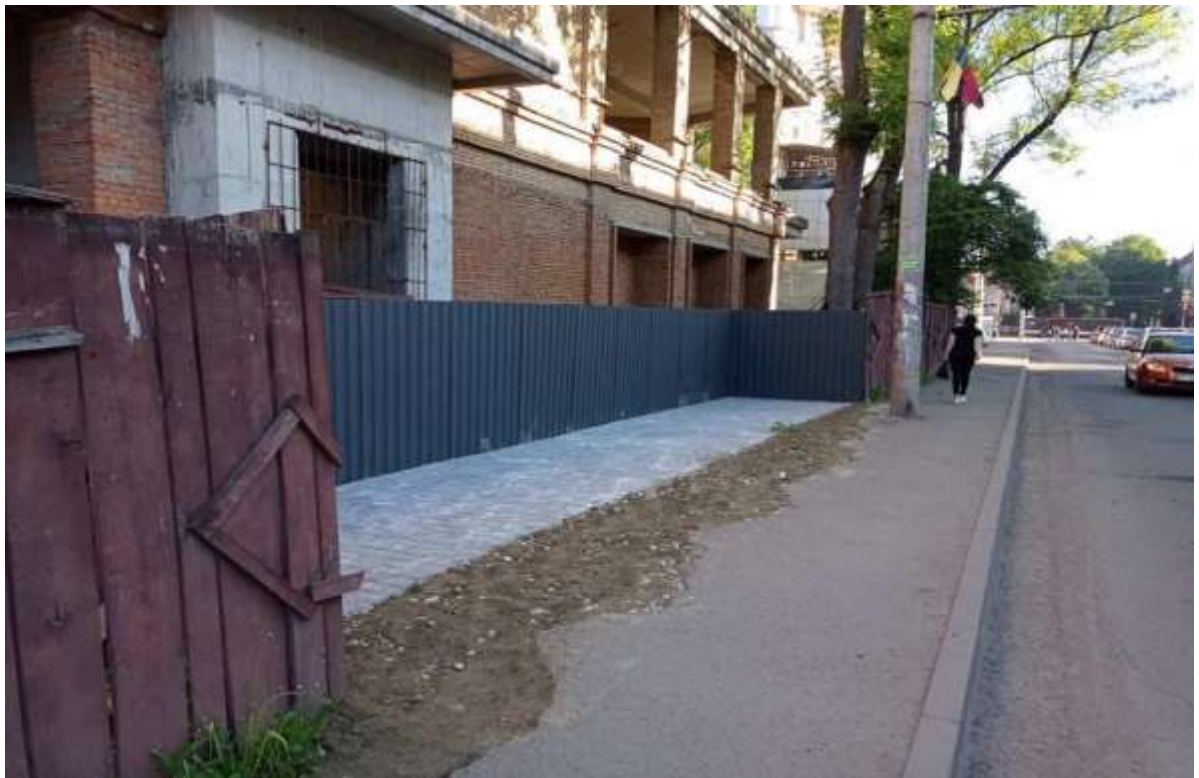
Облаштування контейнерного майданчика на вул. Мельника

У 2021 році по вул. Мельника облаштований новий контейнерний майданчик для збору ТПВ, куди було перенесено контейнери, які розташовувалися на тротуарі по вул. Січових Стрільців.