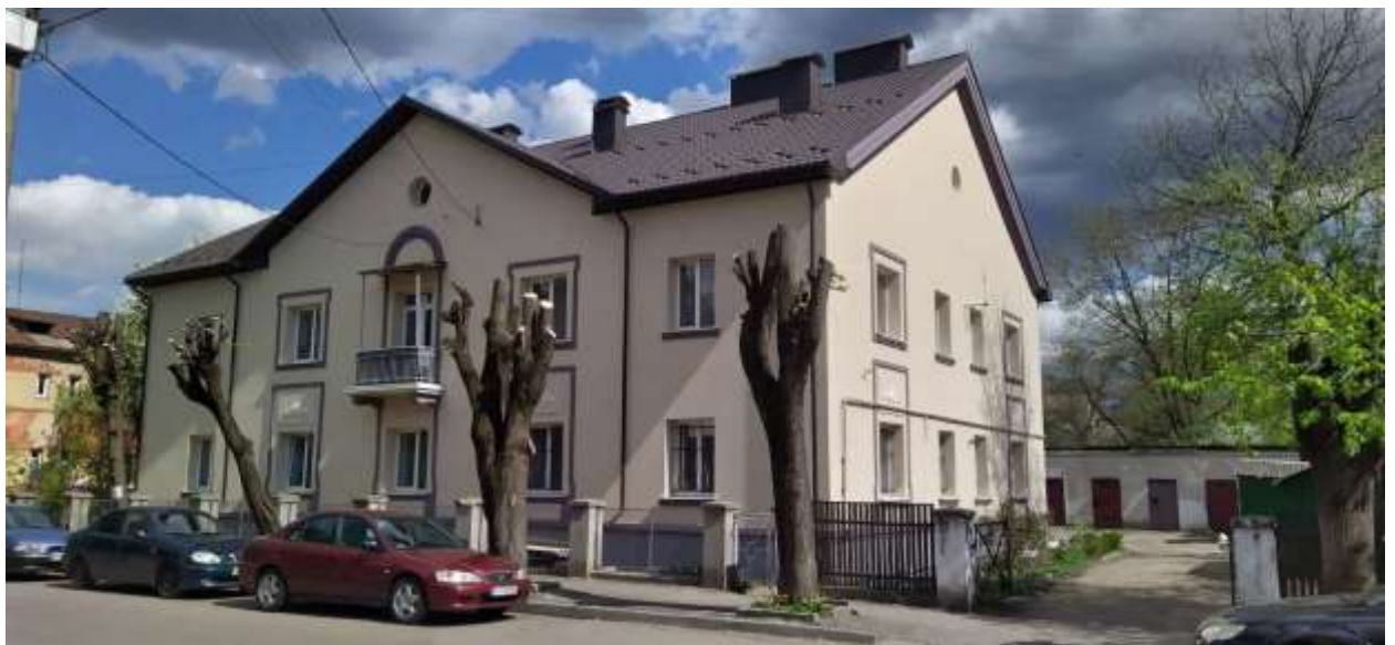
Реалізація програми «Енергодім». ОСББ «Богунська, 4»

Завдяки інформаційній підтримці Департаменту, затвердженню нової Програми впровадження енергоефективних заходів у житловому фонді та створенню револьверного фонду, 4 багатоквартирних будинки (ОСББ «Богунська, 4», ОСББ «Молодіжна, 36», ОСББ «Гердан», ОСББ «Наша господарка») реалізують заходи по програмі «Енергодім», до яких належить комплекс наступних видів робіт: ремонт даху, утеплення горища, стін та цокольних приміщень, заміна вікон та дверей на енергозберігаючі, встановлення системи вентиляції (рекуператорів), модернізація мереж державною установою «Фонд енергоефективності».