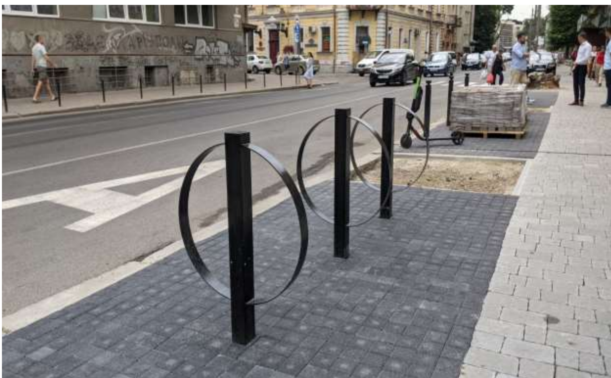
Капітальний ремонт тротуару на перехресті вул. Січових Стрільців – Є. Коновальця

У рамках даних робіт облаштовано: зручні хідники для руху пішоходів, пониження на перетині тротуару з проїжджою частиною, лунки для висадки дерев, а також встановлено вуличні меблі.