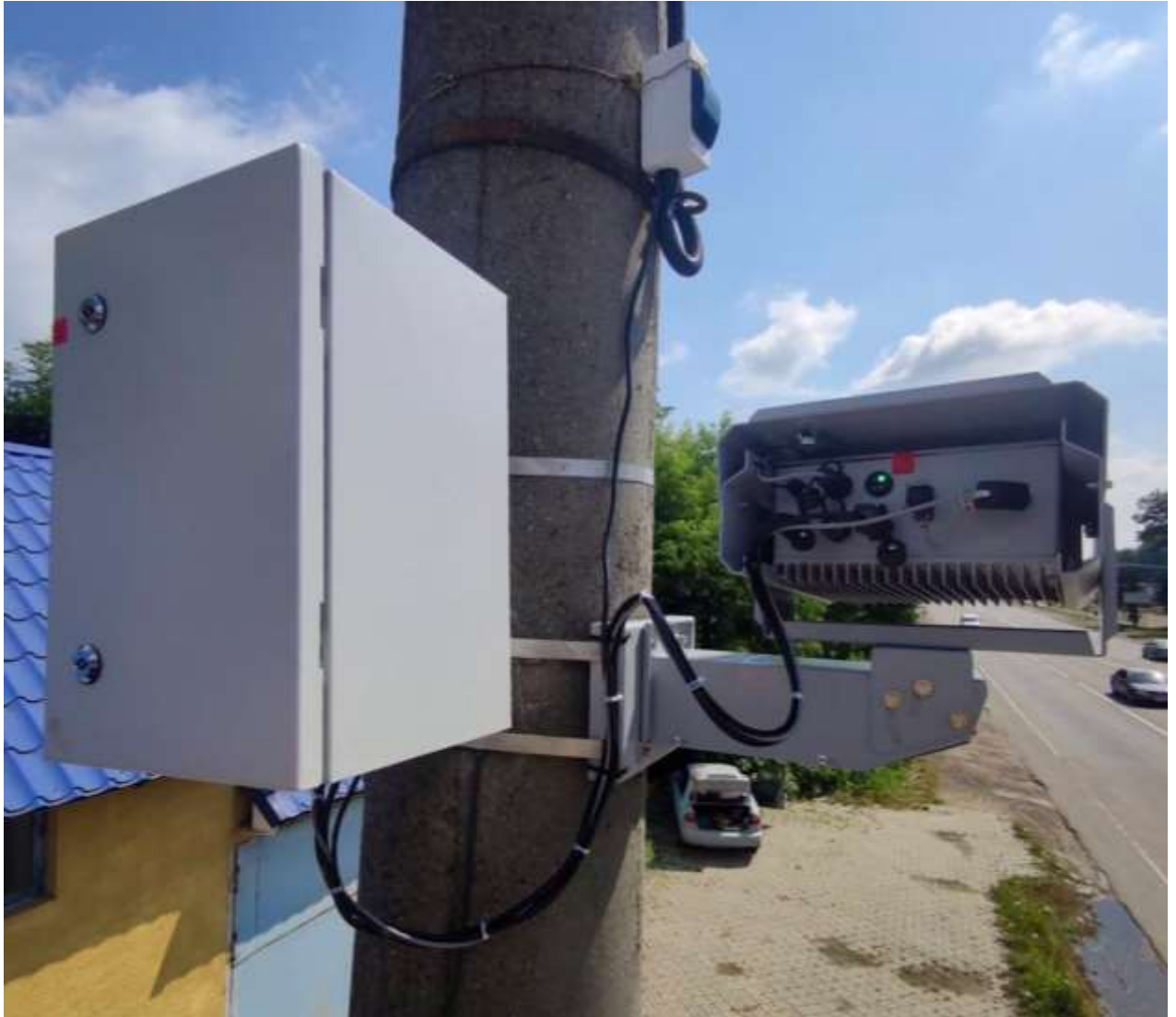
Встановлення комплексів автоматичної фото- та відеофіксації правопорушень

Дані комплекси призначені для автоматичної фото- та відеофіксації проїзду транспортних засобів в зоні контролю, розпізнавання номерних знаків, порівняння розпізнаних номерів зі списками номерних знаків, які знаходяться в розшуку, фіксації подій із ознаками порушень правил дорожнього руху щодо перевищення встановлених обмежень швидкості руху.