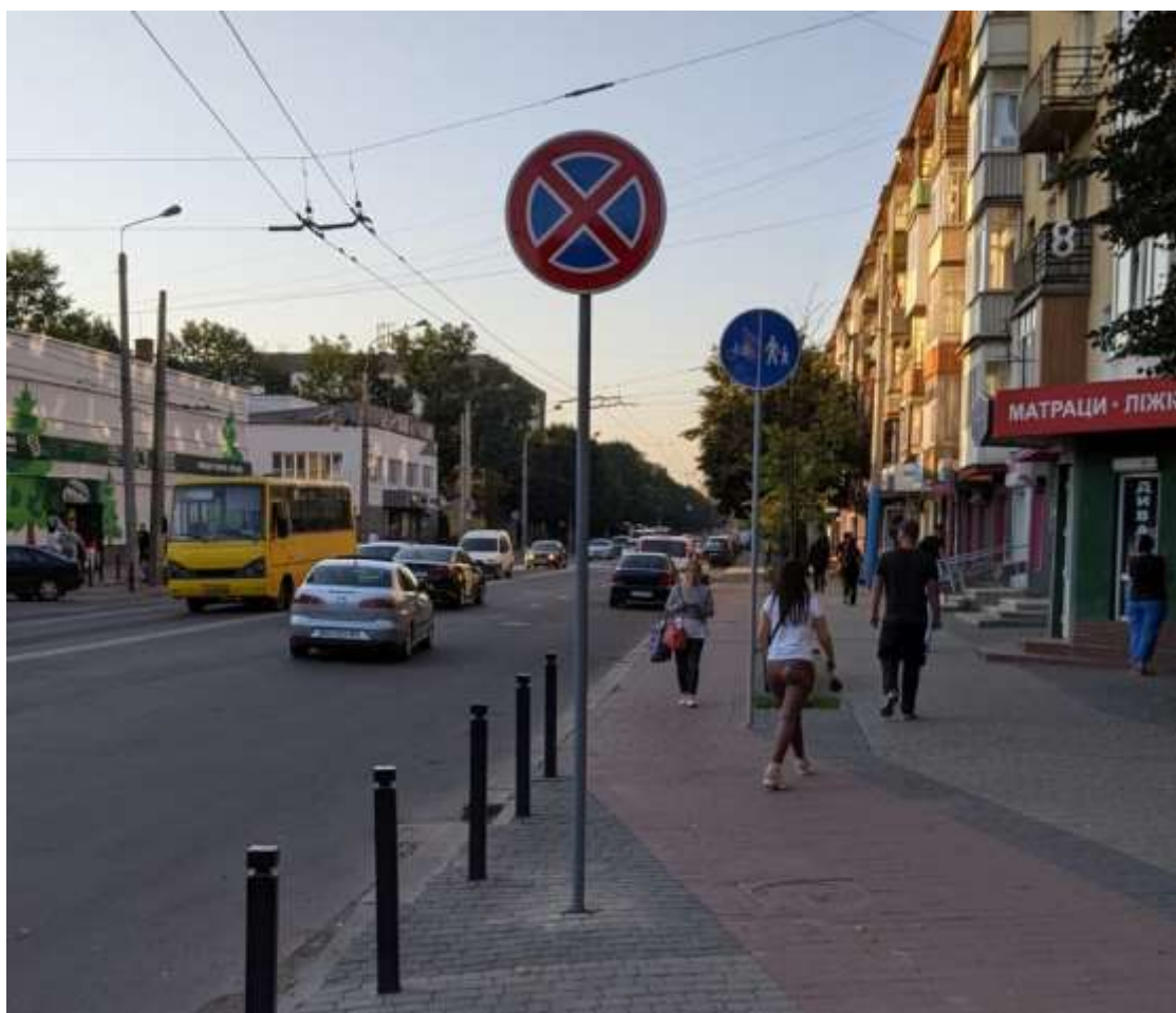
Дорожній знак 3.34 «Зупинку заборонено» на вул. Галицькій

Паралельно до нанесення дорожньої розмітки, зусилля було зосереджено на заміні старих та встановленню нових дорожніх знаків. Впродовж 2021 року замовлено дорожні знаки для 36-ти об'єктів, значну частину з яких уже встановлено на вулицях та дорогах Івано-Франківської міської територіальної громади.