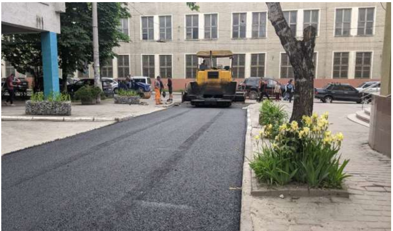
Ремонт проїжджої частини на вулиці, що сполучає вул. Мельника та вул. С. Бандери