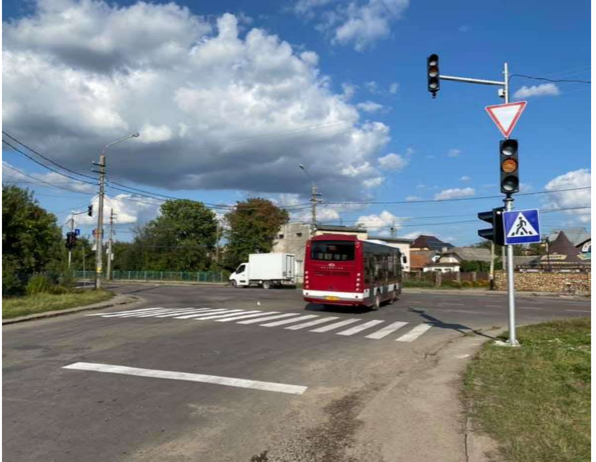
Світлофорний об'єкт на перехресті вулиць Є. Коновальця – Василюшина - О. Довбуша

Не залишилась без уваги і мережа світлофорних об'єктів територіальної громади. У рамках підготовки до святкування Дня Незалежності України, забезпечено реалізацію «Нового будівництва світлофорів на перехресті вулиць Є. Коновальця – Василюшина – О. Довбуша (поворот в с. Чукалівку)».