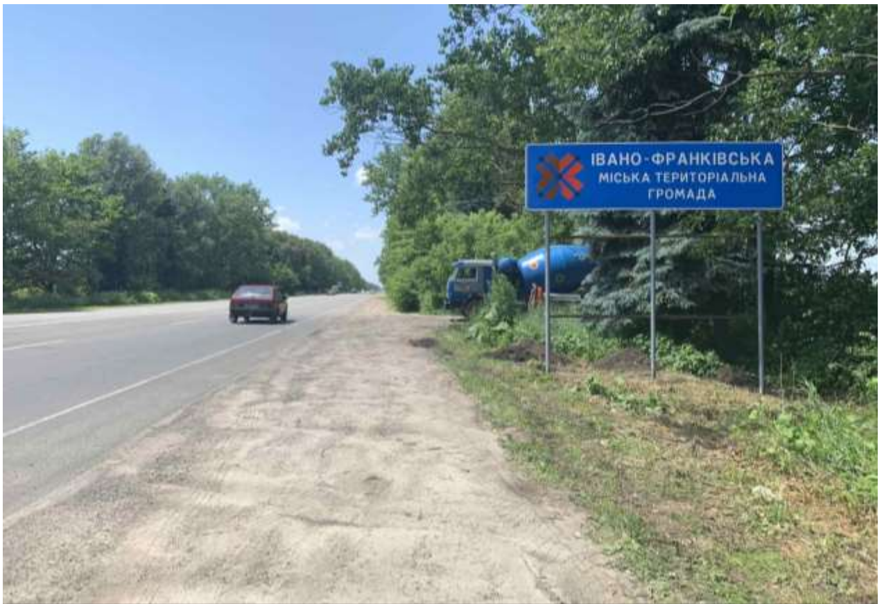
Інформаційні панно на в'їздах та виїздах до населених пунктів ІФ МТГ

Також у рамках підготовки до святкування Дня Незалежності України, забезпечено встановлення у Привокзальному сквері міста Івано-Франківська паротягу, який колись випускали на Локомотиворемонтному заводі. Дана локація слугуватиме чудовою атракцією для мешканців та гостей міста.