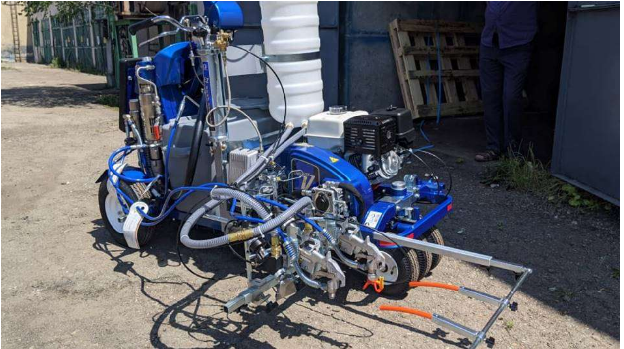
Розміточна машина LINELAZER V 250SPS

Окрім того, з метою підвищення безпеки учасників дорожнього руху на вулицях міста Івано-Франківська та сіл МТГ здійснено придбання обладнання для нанесення дорожньої розмітки для КП «Благоустрій», а саме розміточної машини LINELAZER V 250SPS.