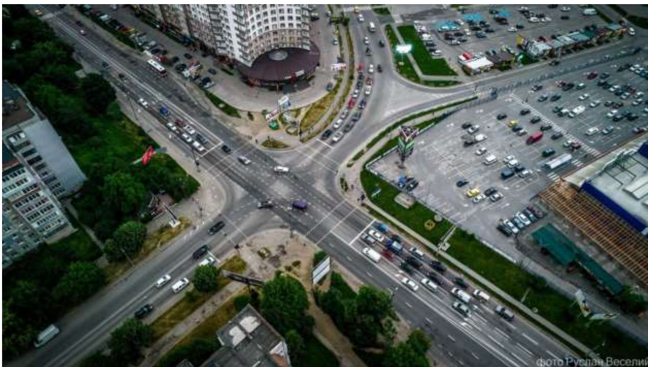
Реалізована схема організації дорожнього руху на вул. Івасюка