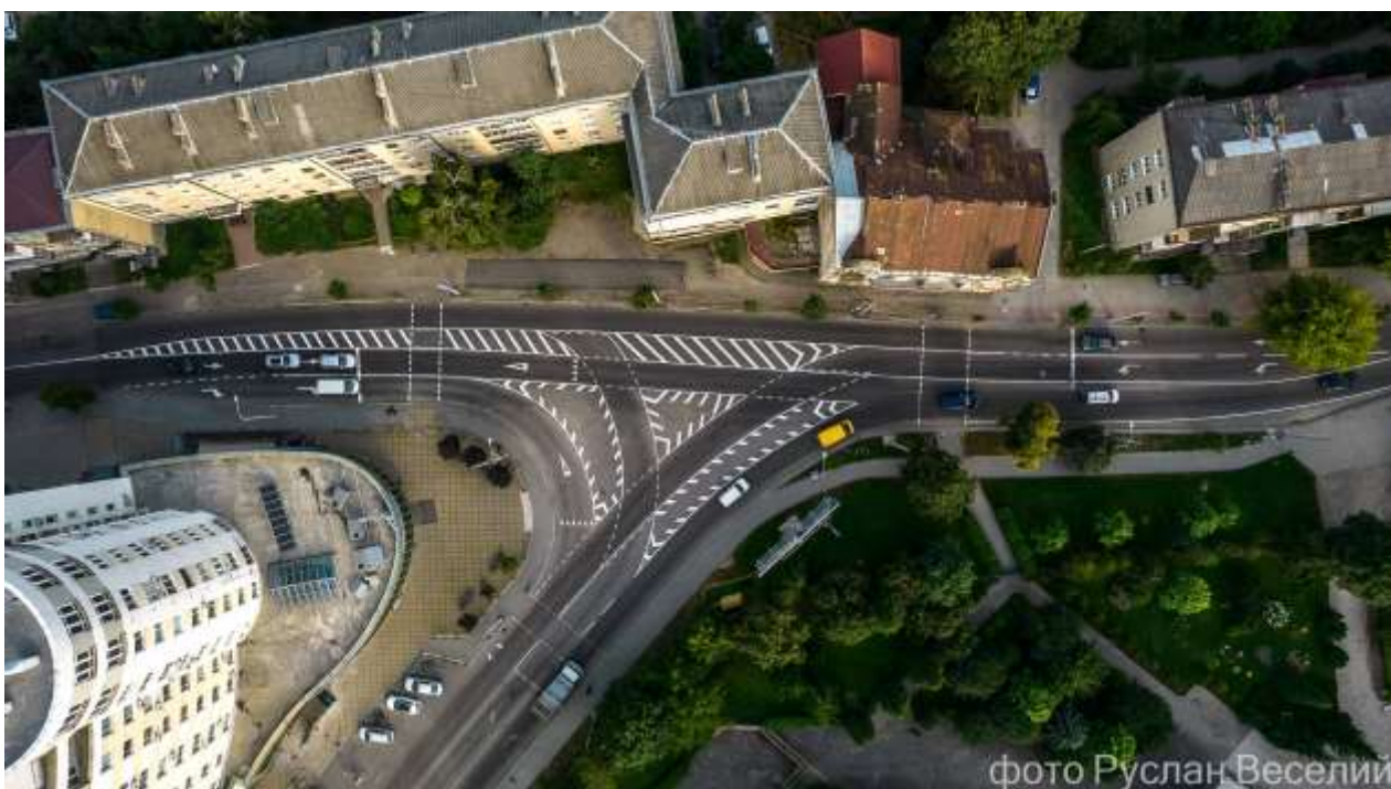
Проміжний етап реалізації схеми організації дорожнього руху на перехресті вул. Гетьмана Мазепи – Гурика

Також напрацьовано та буде реалізовано до кінця поточного року проекти організації дорожнього руху на Калуському шосе, вулицях Сахарова, Крука, Підгірянки, Тролейбусній, Чорновола та кільцевій розв'язці вул. Надрічної – Галицької – набережної ім. В. Стефаника.