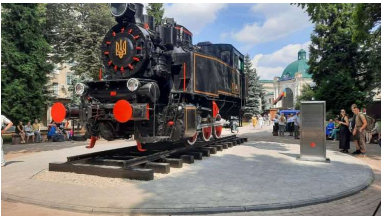
Локомотив у Привокзальному сквері міста Івано-Франківська

Також у рамках підготовки до святкування Дня Незалежності України, забезпечено встановлення у Привокзальному сквері міста Івано-Франківська паротягу, який колись випускали на Локомотиворемонтному заводі. Дана локація слугуватиме чудовою атракцією для мешканців та гостей міста.