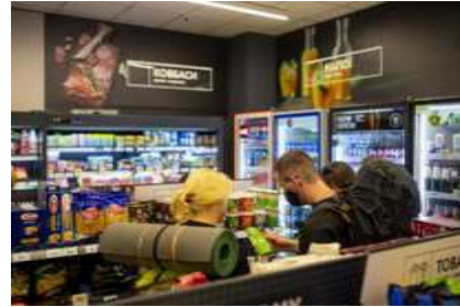
Зручний маркет «Сім 23»

Для впорядкування здійснення дрібнороздрібної торгівлі, надання послуг у сфері розваг та проведення ярмарок на території міста розроблено нове Положення про дрібнороздрібну торгівлю, надання послуг у сфері розваг та проведення ярмарків, яке затверджене рішенням виконавчого комітету Івано-Франківської міської ради від 13.05.2021р. № 692. Крім цього, розроблено схему розміщення об'єктів дрібнороздрібної торгівлі та надання послуг у сфері розваг на 2021 рік.