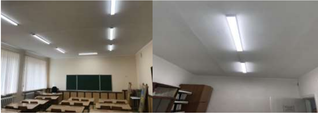
Ліцей №4 (виготовлення меблів), Початкова школа №8 (ремонт приміщення).