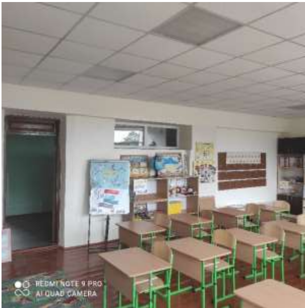
Центр освітніх інновацій (придбання мультимедійної дошки, ноутбука).