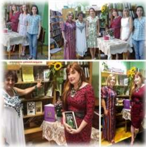
- творча зустріч з поетесою Галиною Коризмою: