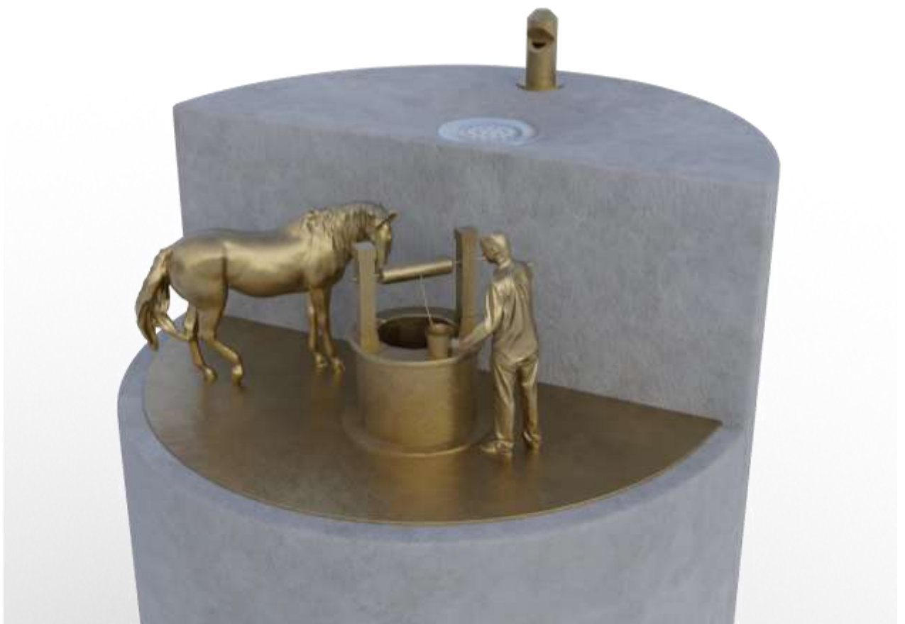
Ескізні пропозиції до проєкту «Відновлення питних джерел в історичному середмісті Івано-Франківська»

«Відновлення питних джерел в історичному середмісті Івано-Франківська» та отримано грант в розмірі 250,0 тис. грн. Метою проєкту є влаштування криниць в історичній частині міста з відтворенням їх середньовічного вигляду. Зазначеним проєктом передбачається проведення досліджень, аналізу та розробки проектно-кошторисної документації для відновлення трьох криниць, а також здійснення промоційних заходів для популяризації культурної спадщини міста та підвищення його туристично-рекреаційного потенціалу. Крім того, дані криниці слугуватимуть джерелом питної води для мешканців міста, туристів та гостей, а також і для тварин.