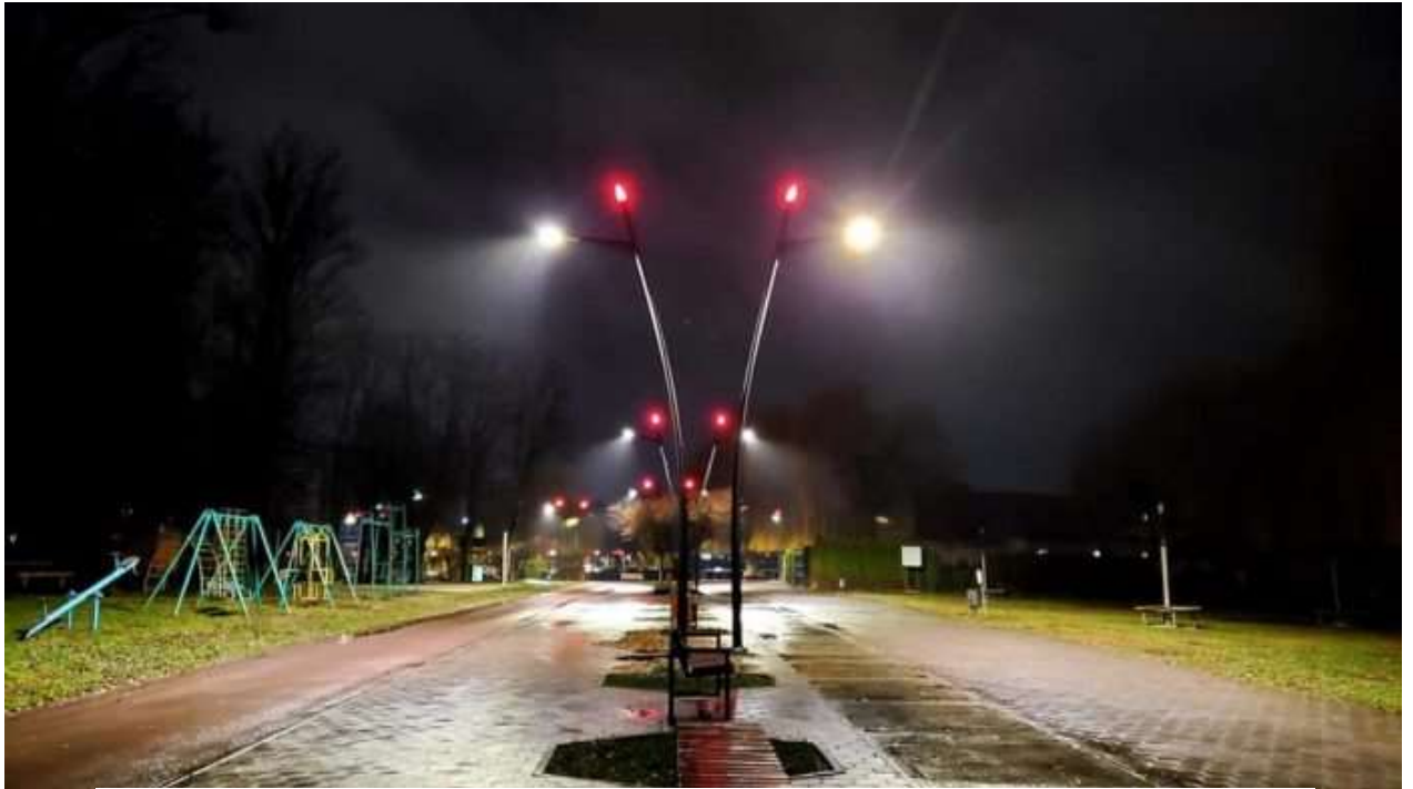
Реконструкція зовнішнього освітлення міського озера на вул. Гетьмана Мазепи

У 2020 році була продовжено роботи з влаштування відпочинкової інфраструктури на міському озері. Цьогоріч виконано роботи з монтажу основного освітлення, змонтовано лавочки та урни. Також виконано роботи з нанесення дорожньої розмітки на велосипедній доріжці.