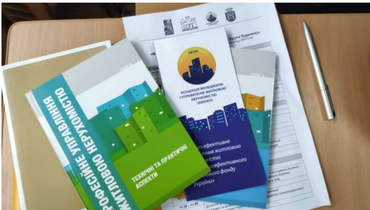
Курси підвищення кваліфікації для керівників ОСББ

З метою належного та вчасного інформування, а також вирішення невідкладних звернень щодо функціонування житлового фонду створено відповідні вібер-групи з тематичних питань.