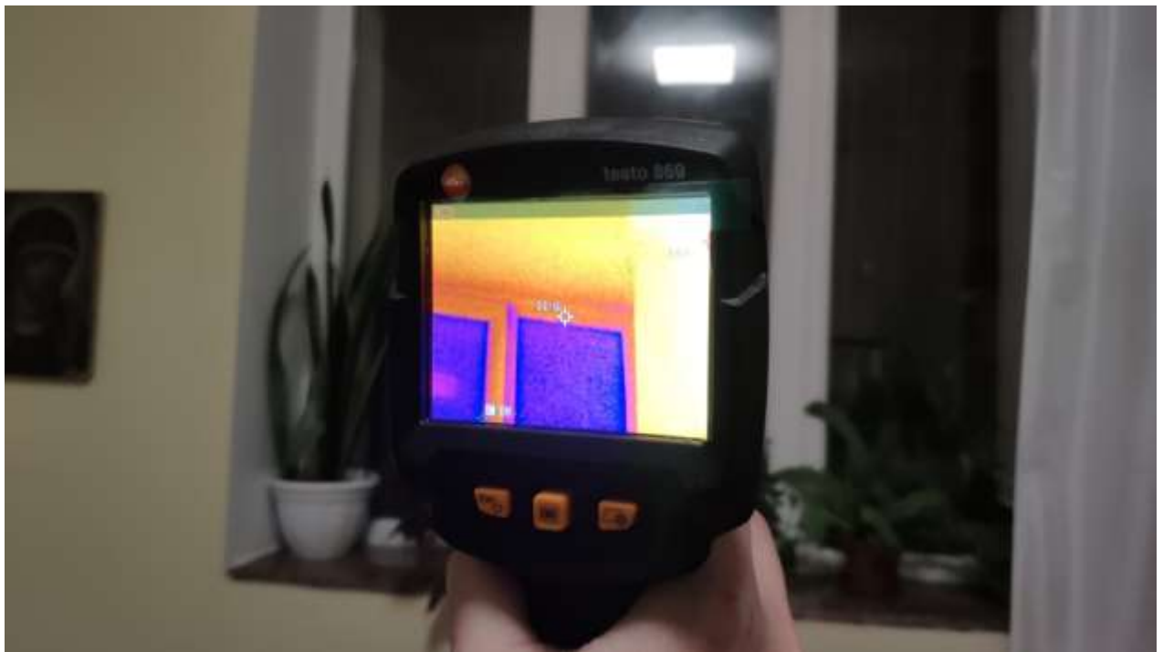
Реалізація програми «Енергодім»

Також Департаментом організовано курси підвищення кваліфікації для керівників ОСББ за спеціальністю «Менеджер (управитель) житлового будинку (групи будинків)» з врученням відповідних сертифікатів.