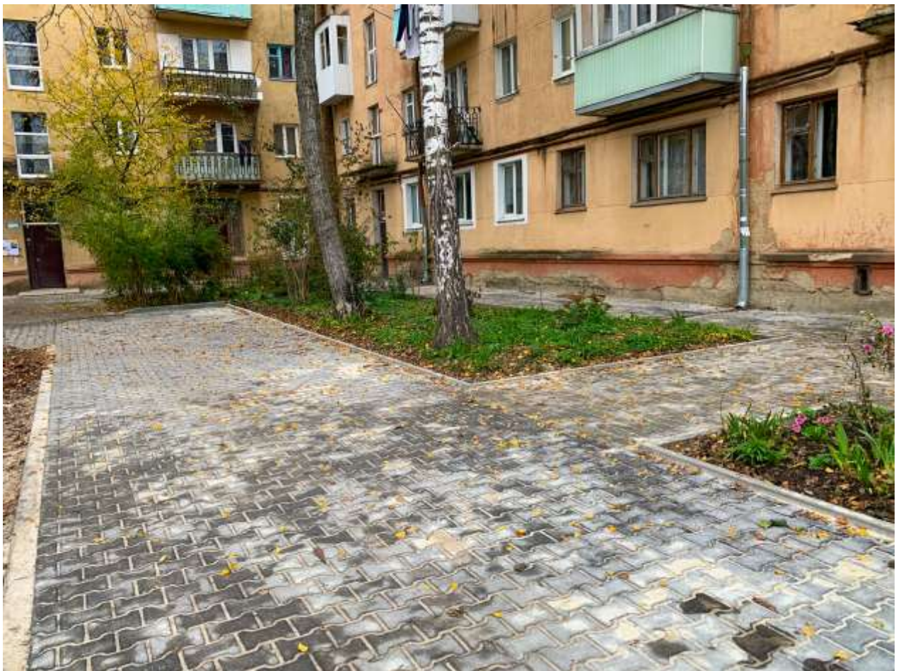
Капітальний ремонт міжбудинкових проїздів та прибудинкових територій на вул. Бельведерській, 53, 55 та вул. Вороного, 4