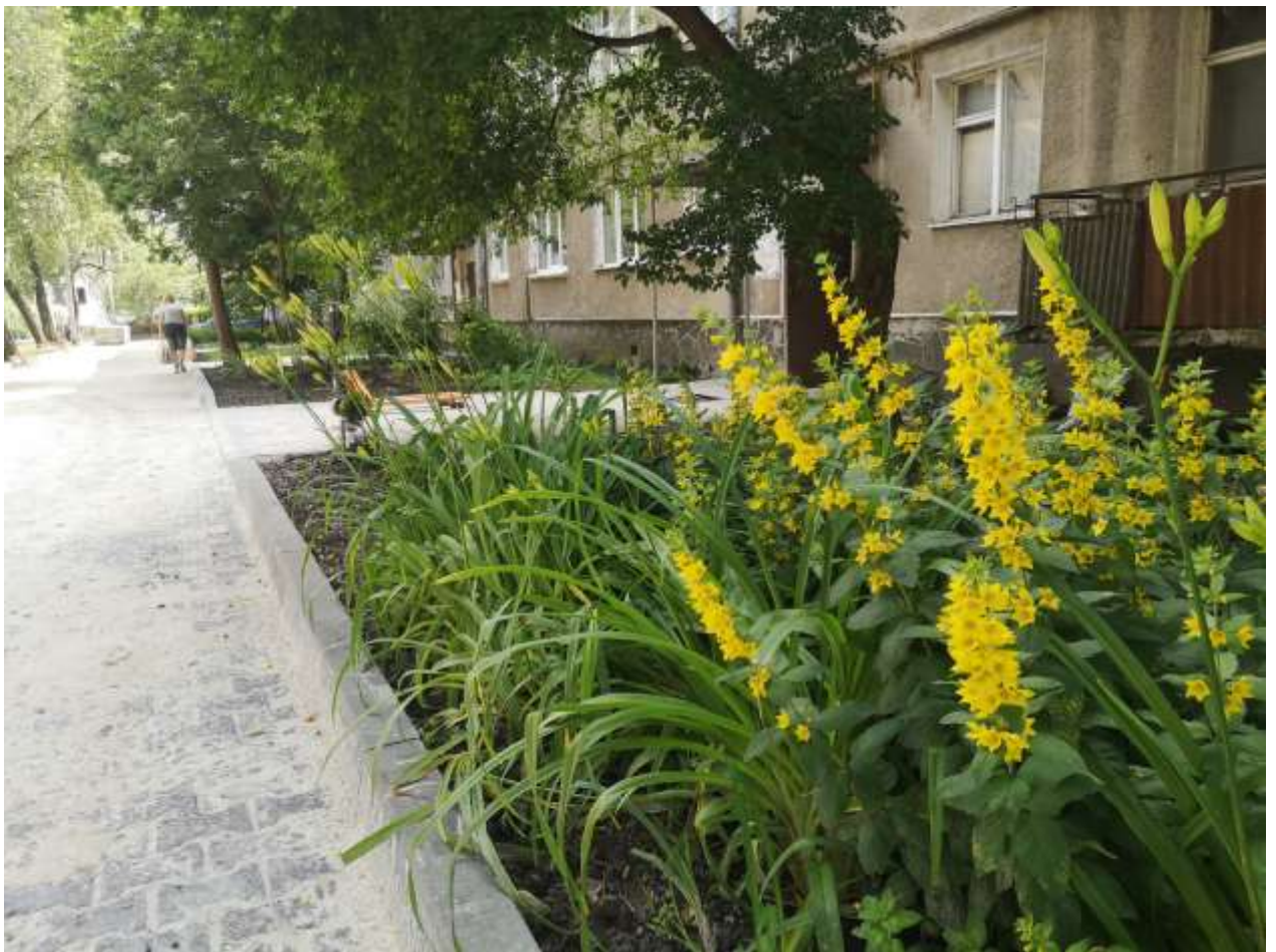
Капітальний ремонт міжбудинкових проїздів та прибудинкових територій на вул. Республіканській, 3 - вул. Чорновола, 81, 83