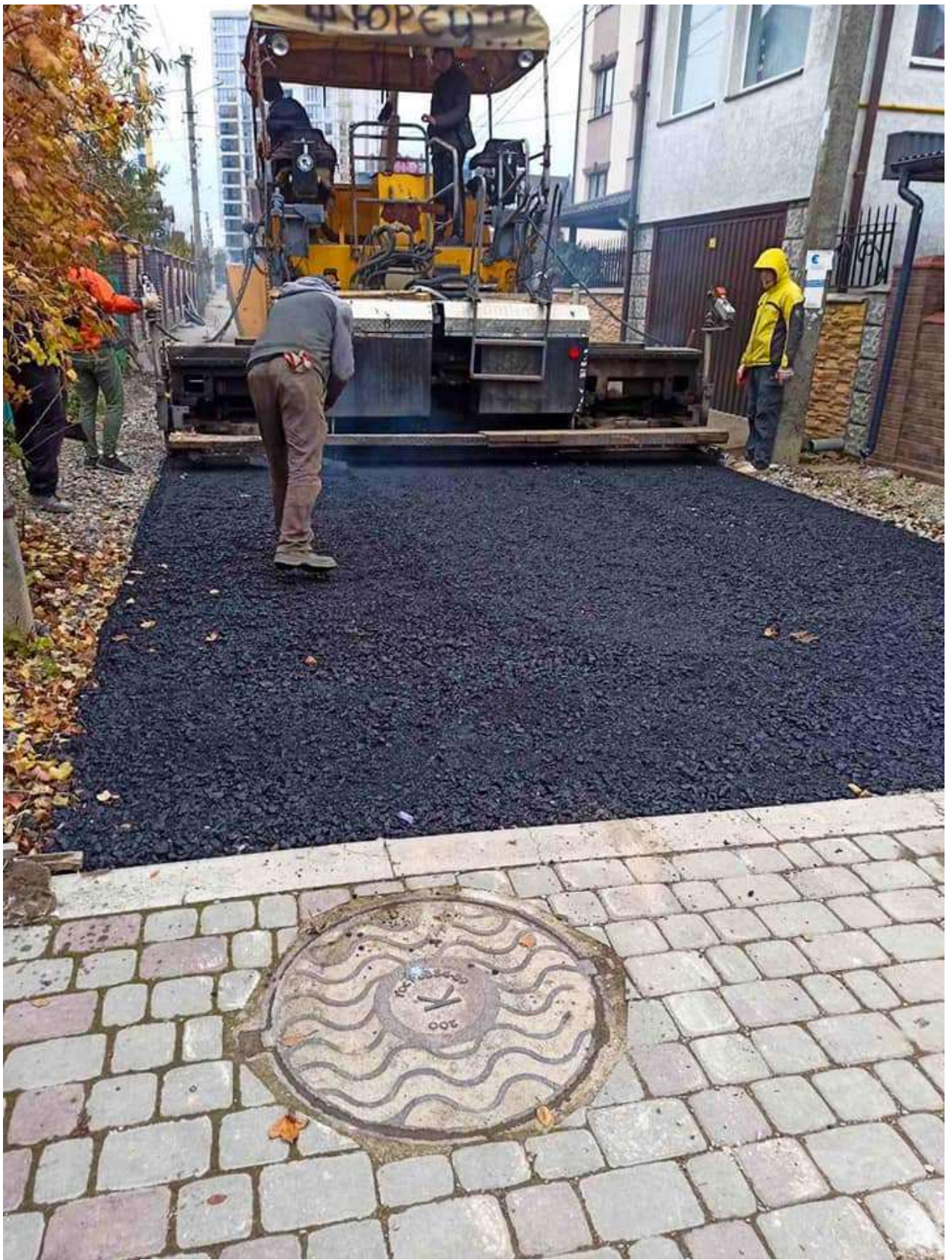
Капітальний ремонт проїзду від вул. Угорницької до будинку 40Б на вул. О.Кисілевської в м. Івано-Франківську