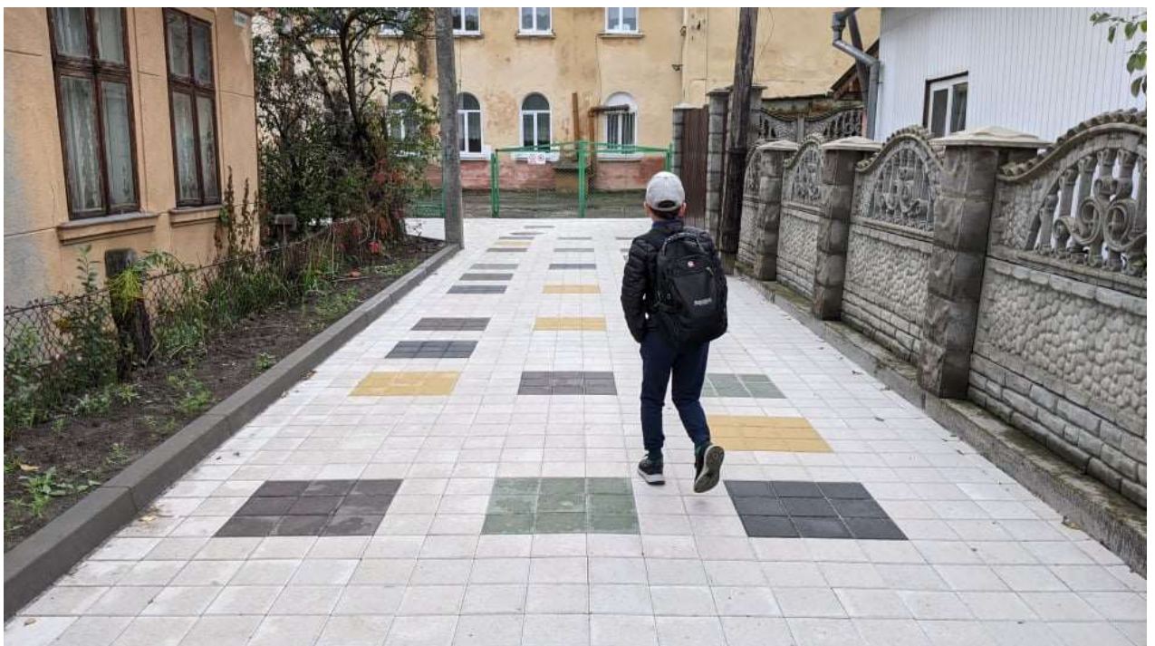
Капітальний ремонт проїзду від вул. Б.Хмельницького до ліцею № 16 в м. Івано-Франківську