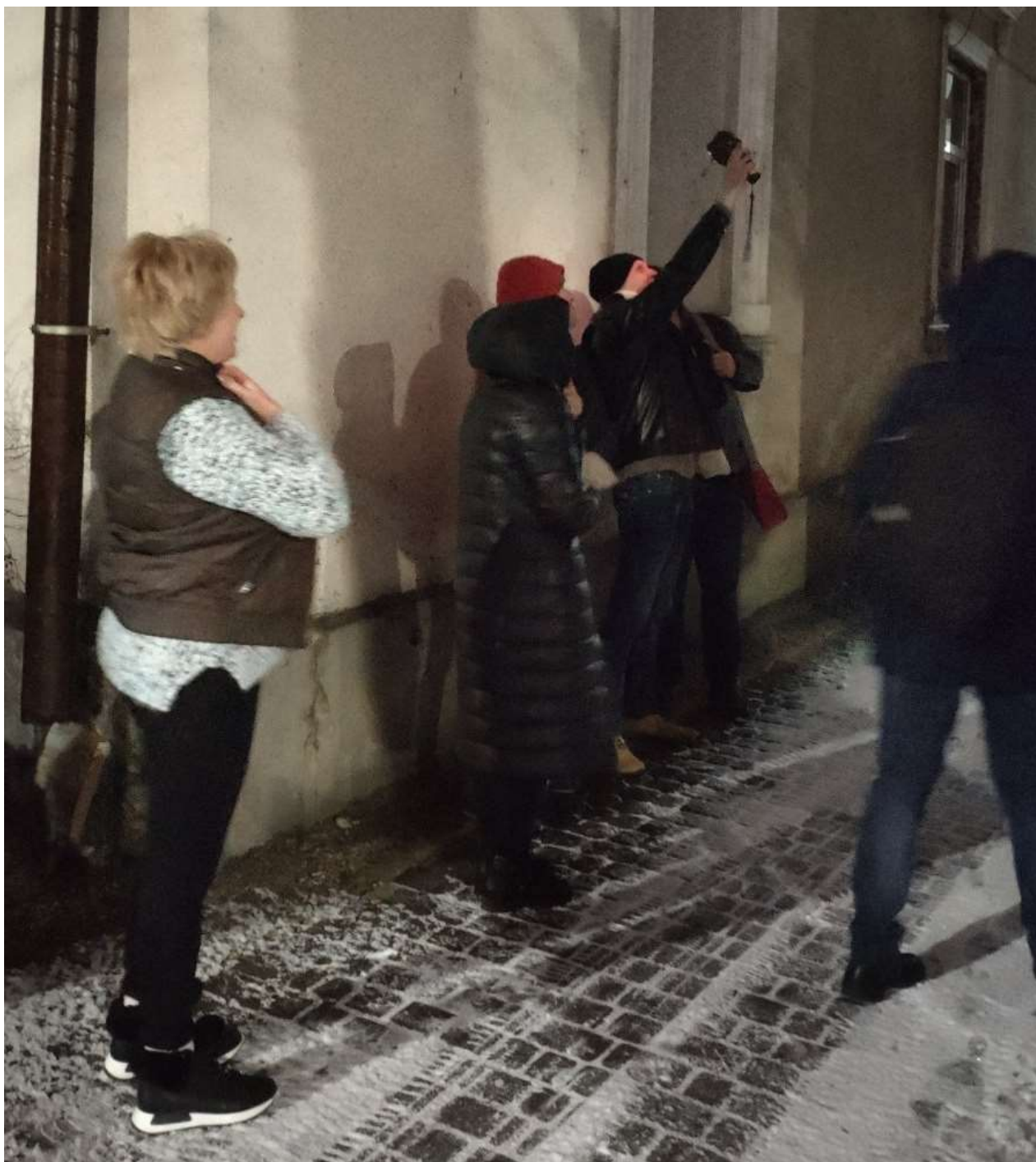
Реалізація програми «Енергодім»