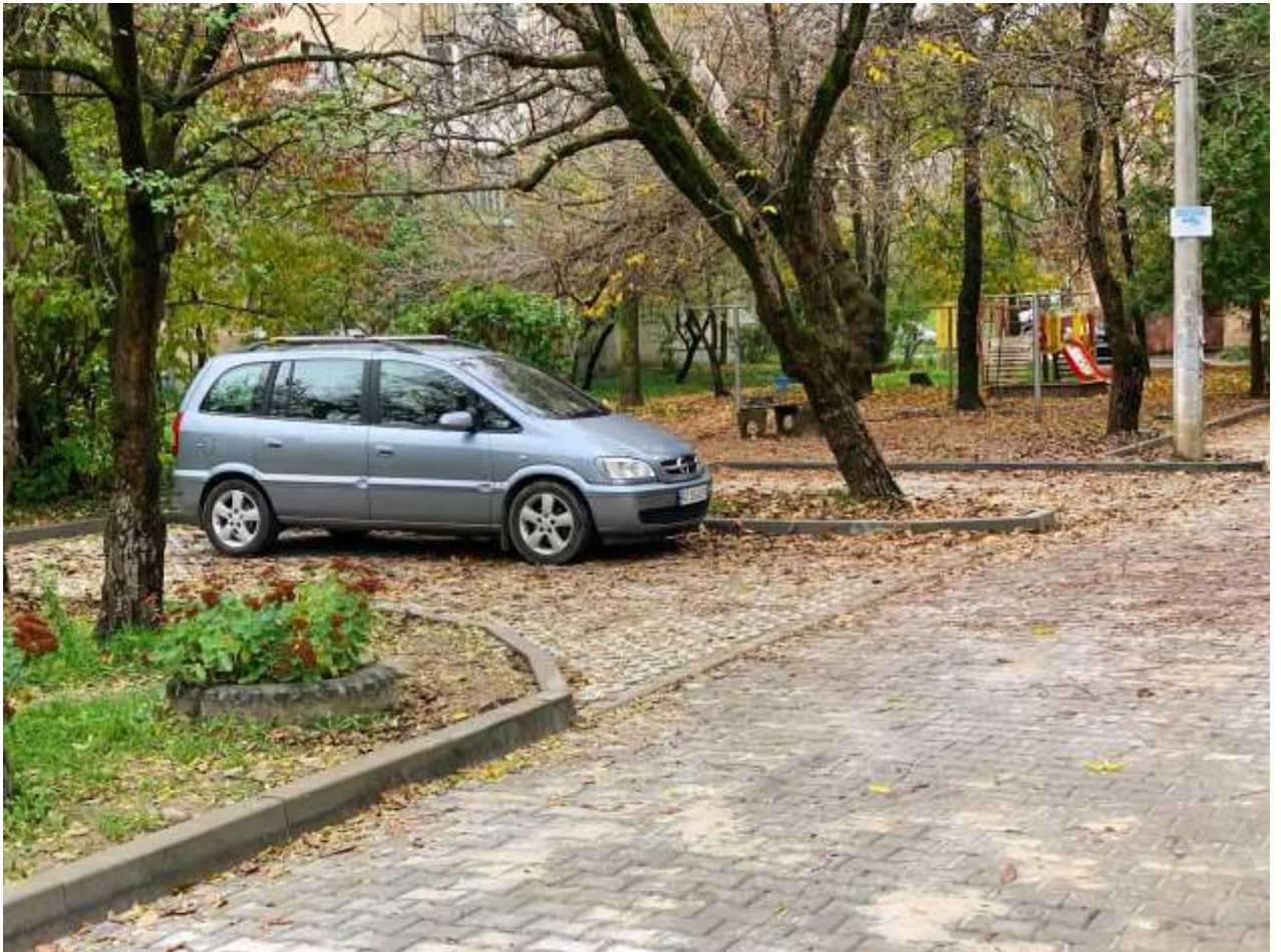
Виконання капітального ремонту міжбудинкового проїзду та прибудинкової території на набережній ім. В. Стефаника, 4