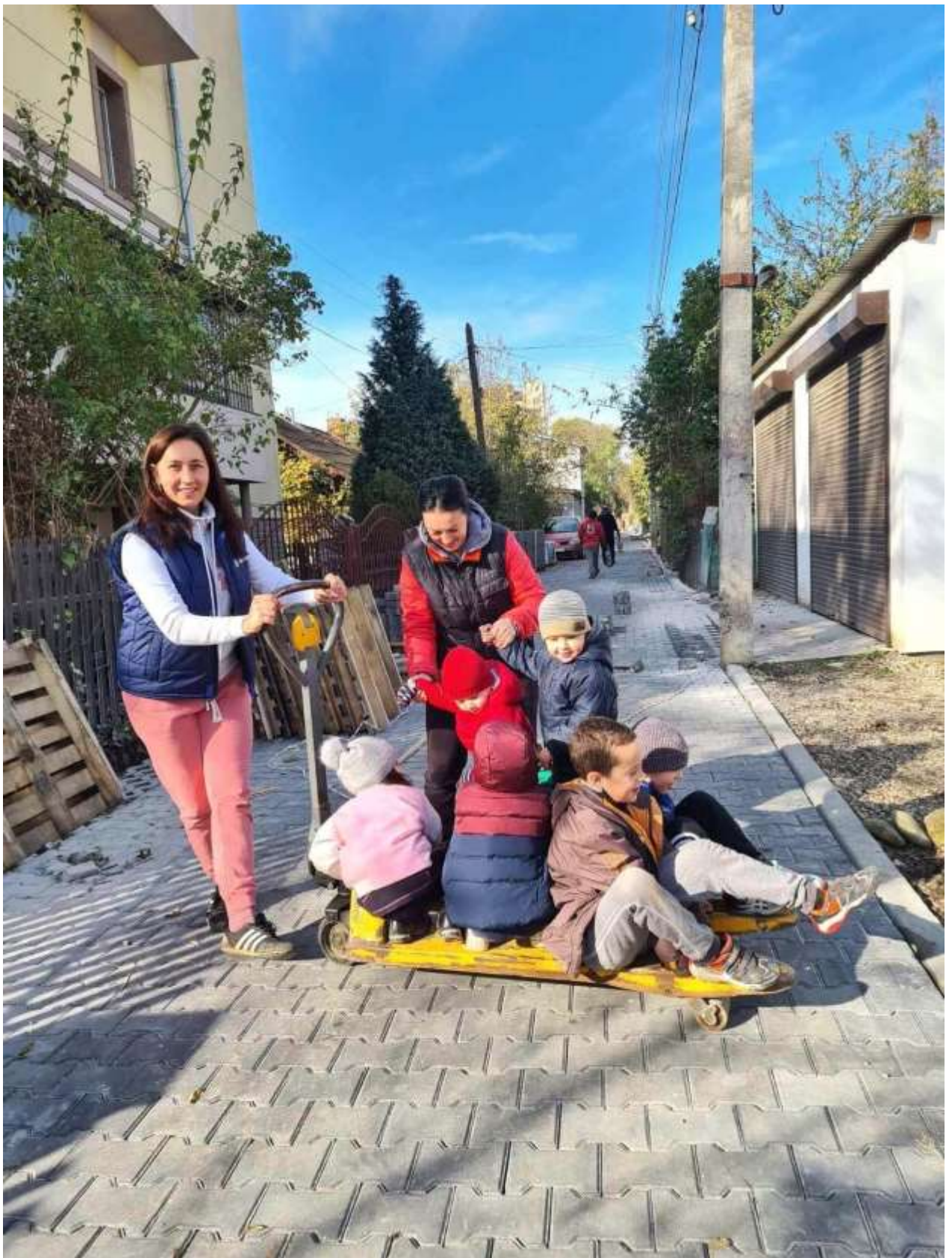
Капітальний ремонт проїзду від вул. Каменярів до вул. Миру в м. Івано-Франківську