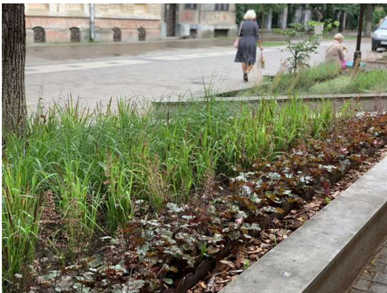
Влаштування клумб на вул. Шевченка