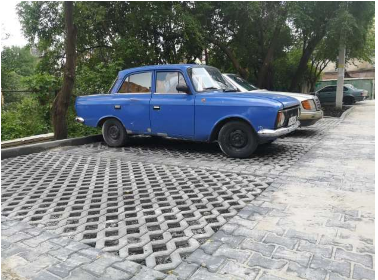
Капітальний ремонт міжбудинкових проїздів та прибудинкової території на вул. Республіканській, 5А