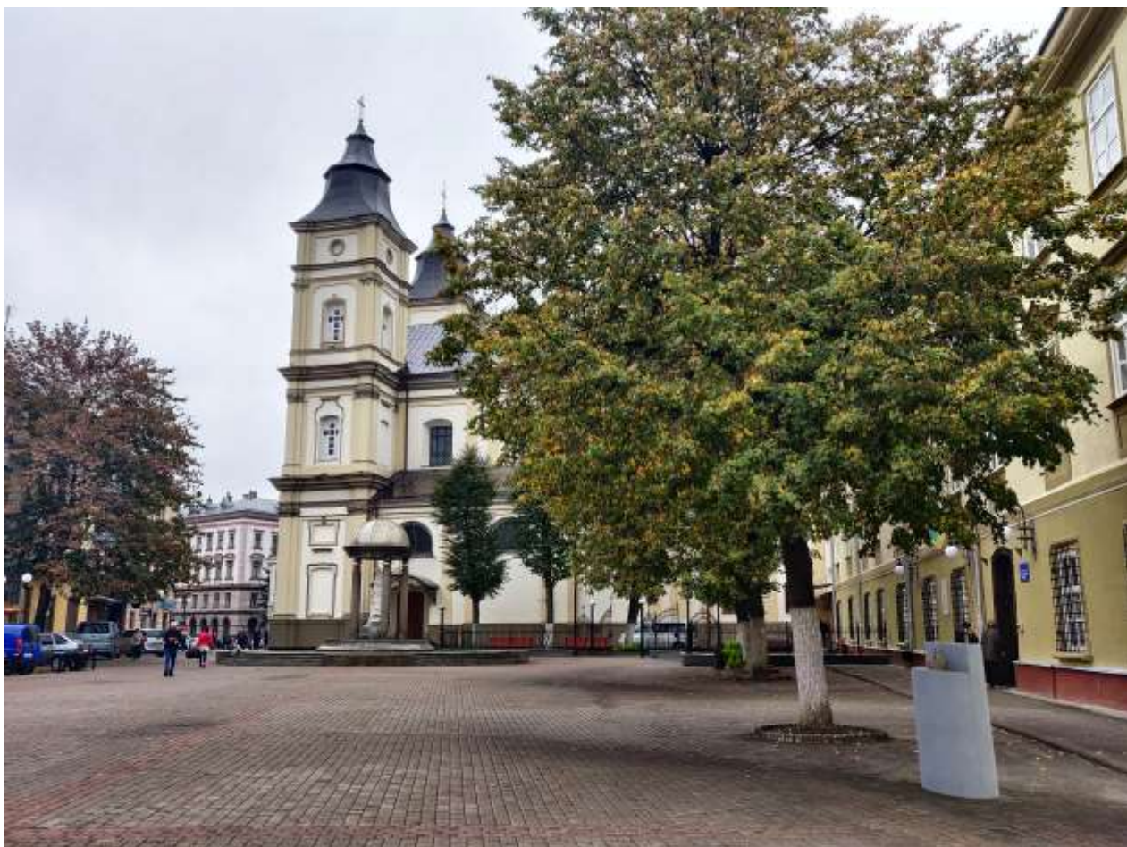
Ескізні пропозиції до проєкту «Відновлення питних джерел в історичному середмісті Івано-Франківська»