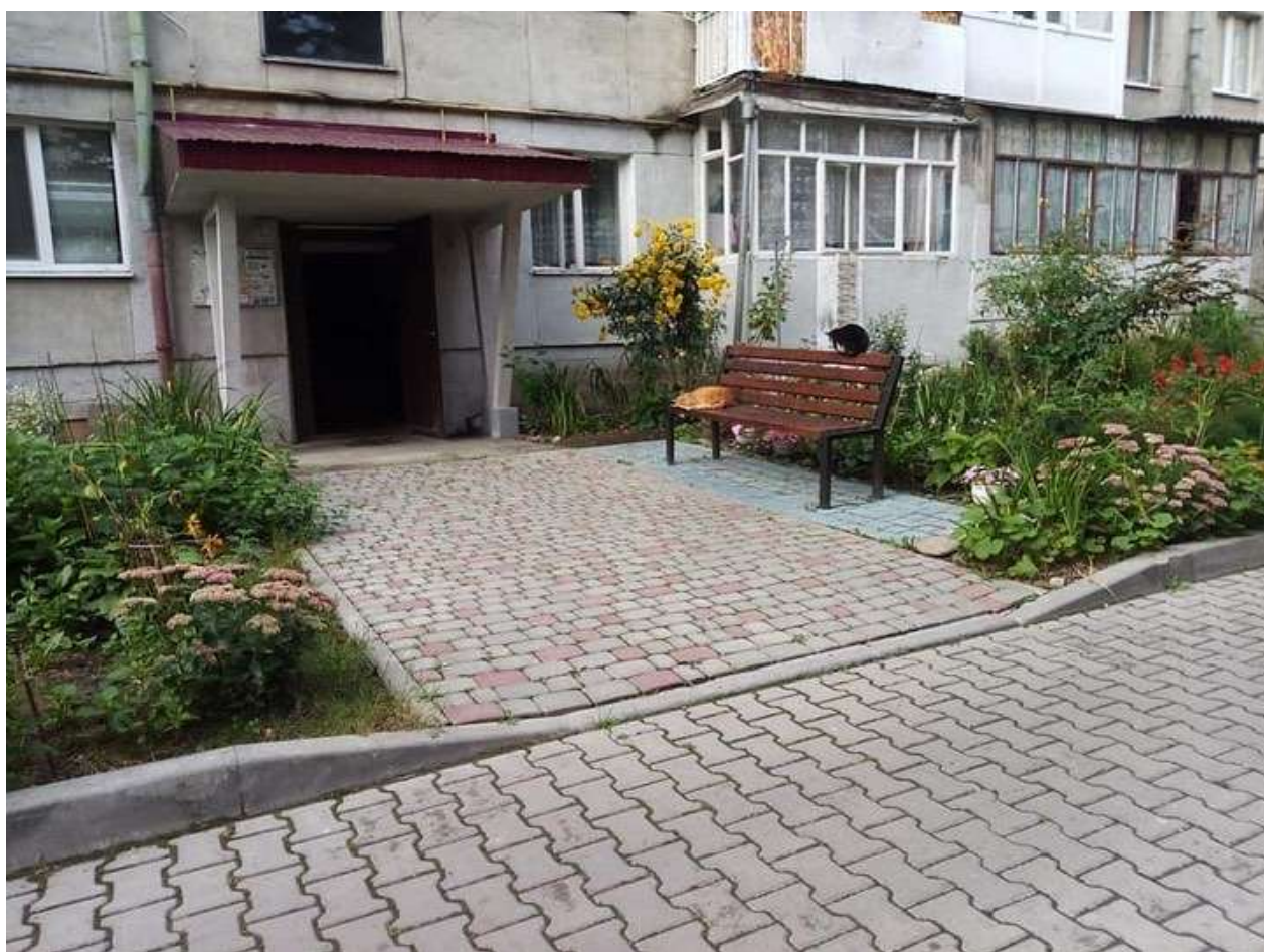
Капітальний ремонт міжбудинкового проїзду та прибудинкової території на вул. Незалежності, 152, 152А