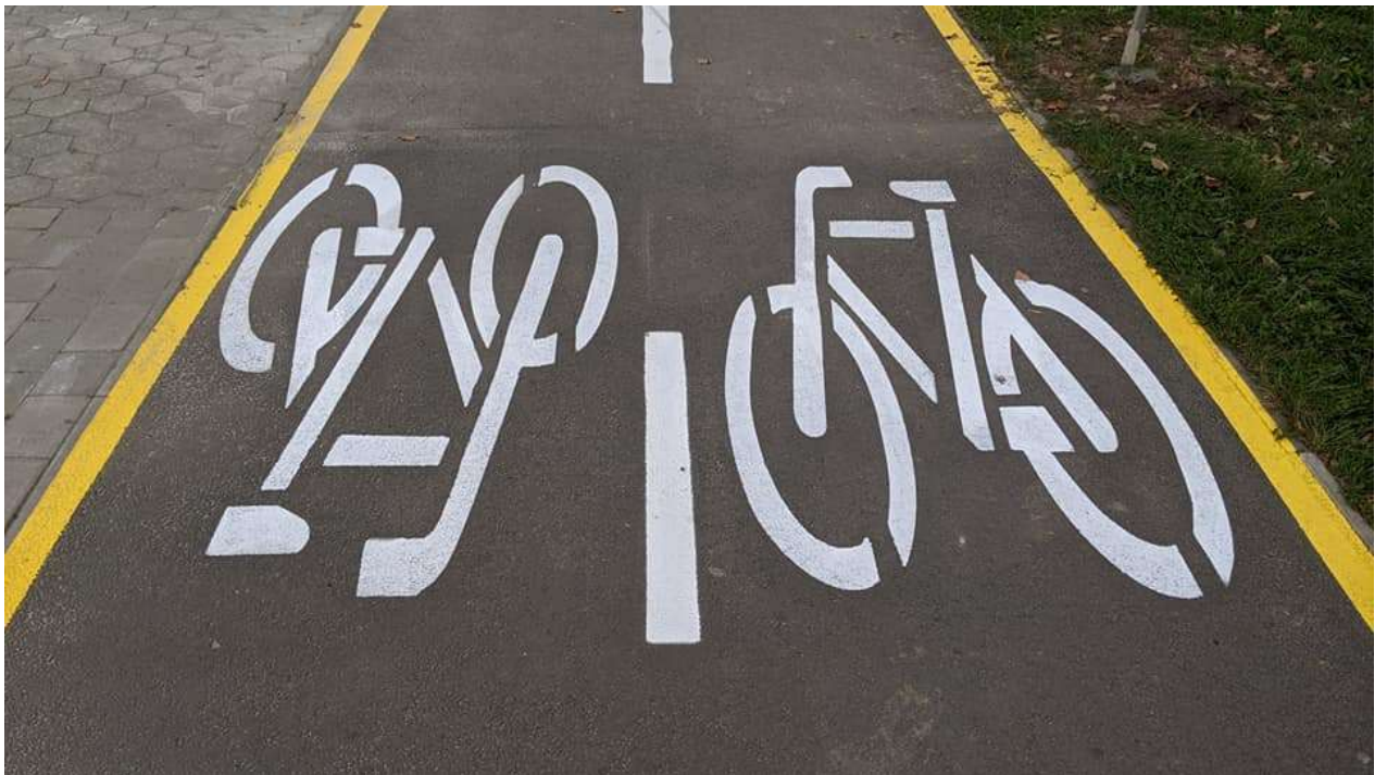
Нанесення розмітки та встановлення дорожніх знаків на велодоріжці на міському озері