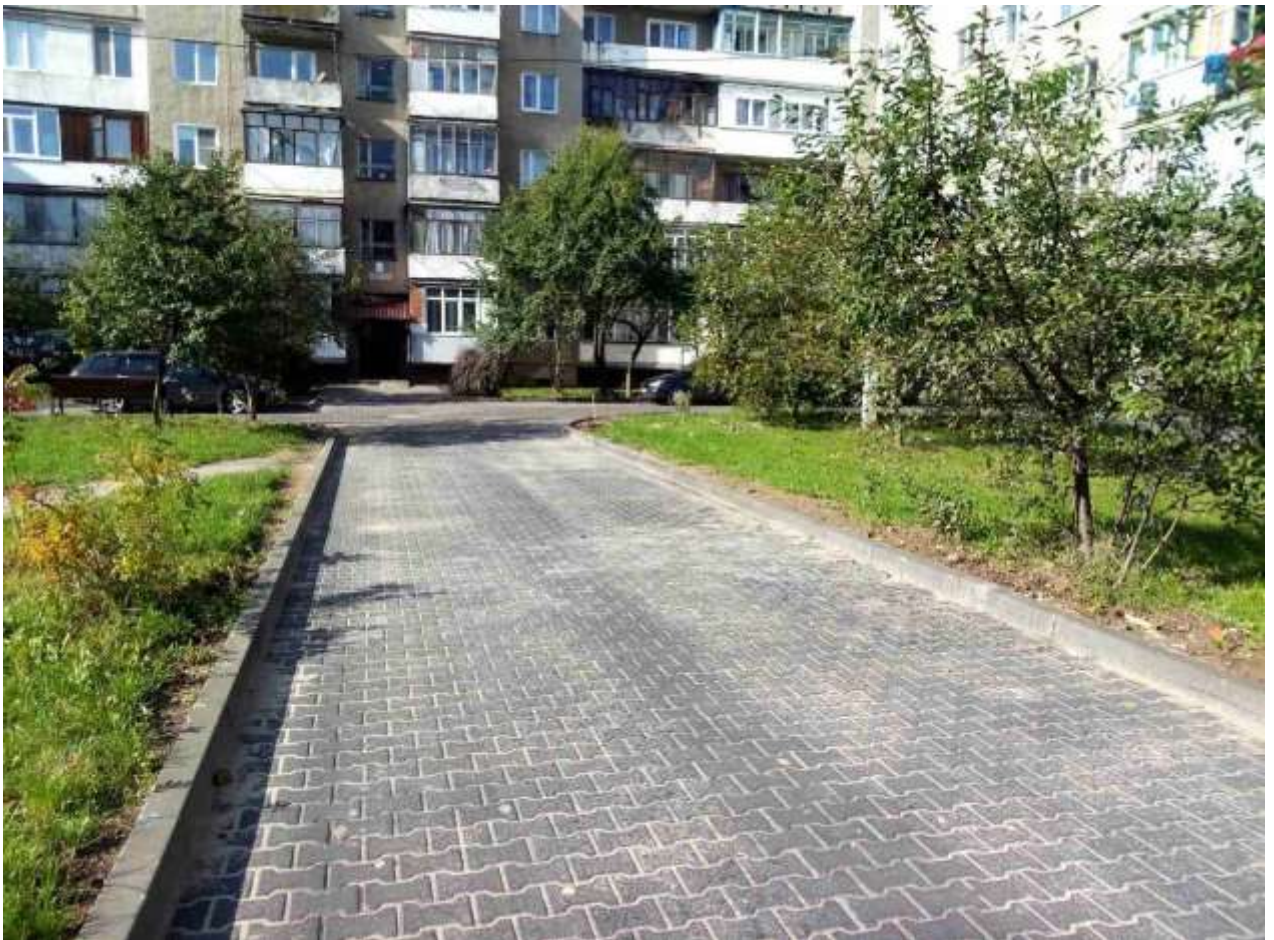
Капітальний ремонт міжбудинкових проїздів та прибудинкових територій на вул. Гетьмана Мазепи, 173 корп. 2 та виїзду на вул. Гетьмана Мазепи