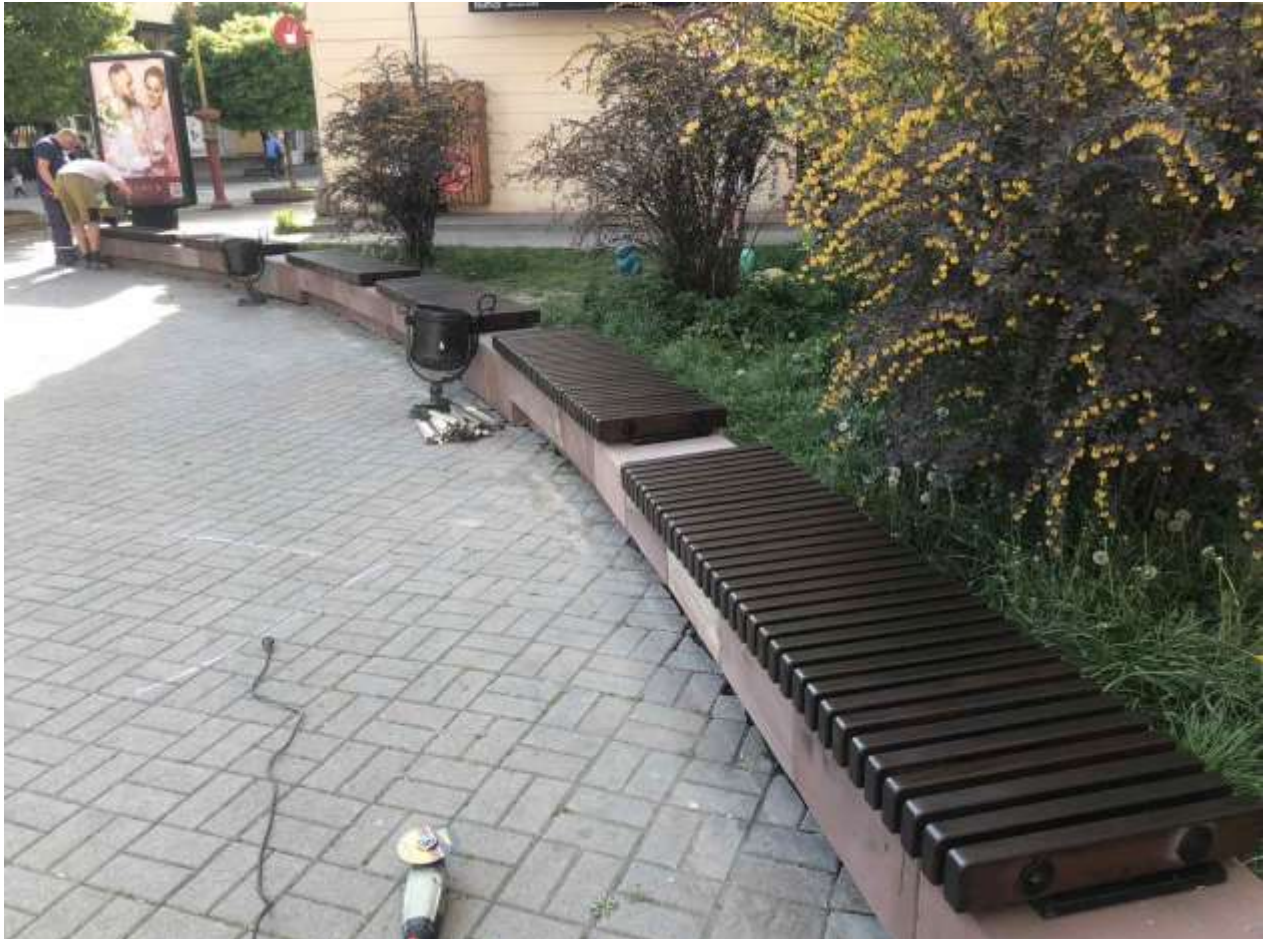
Встановлення лавок поруч міської стоматологічної поліклініки на вул. Незалежності, 17

На встановлення МАФ та інших елементів благоустрою на 2020 рік Департаменту було передбачено 2214,53 тис. грн., що на 1177,57 тис. грн. менше ніж у 2019 році. Більшість коштів було направлено на влаштування лавок, урн та елементів благоустрою. Всього за 2020 рік встановлено 20 лавок, 10 урн та 21 антипаркувальний стовпець.