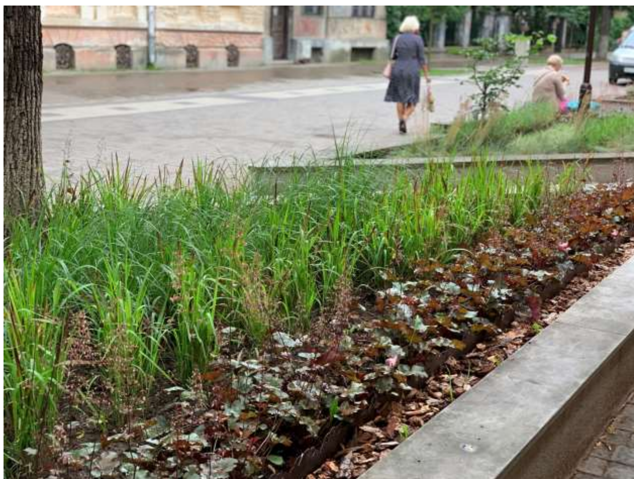
Влаштування клумб на вул. Шевченка