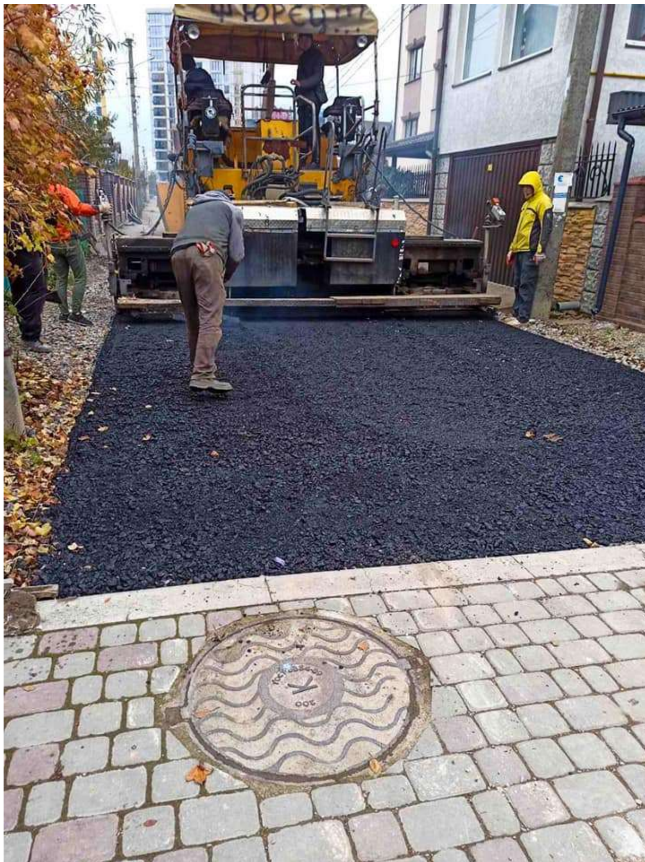
Капітальний ремонт проїзду від вул. Угорницької до будинку 40Б на вул. О.Кисілевської в м. Івано-Франківську