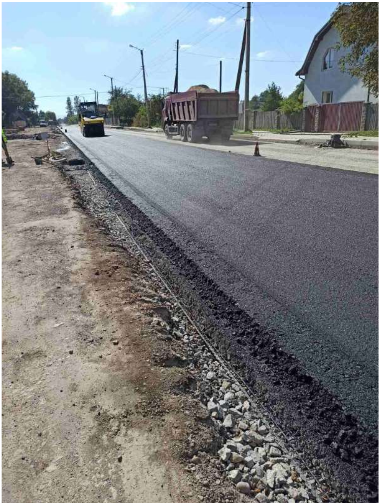
Реконструкція вул. Автоливарівської (від залізничного переїзду до вул. Юності)

Не залишились без уваги і села, приєднані до Івано-Франківської міської територіальної громади. Тож в поточному році вдалось виконати роботи з капітального ремонту дорожнього покриття вул. Кіндрата (від вул. Надвірнянської), вул. Хмельницького (від буд. № 23), вул. С. Бандери (від буд. № 2) та вул. І. Франка (від вул. Кіндрата) в с. Чернієві.