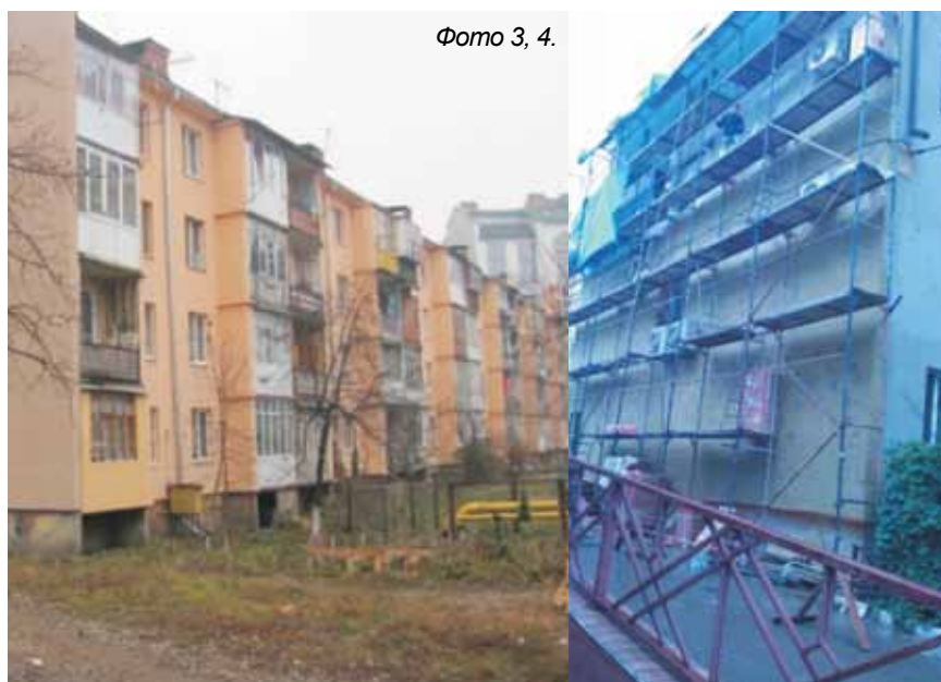
Фото 3, 4.

Під час пілотного проекту з проведення санації для житлового будинку було визначено теплові втрати через огорожувальні конструкції, намічені необхідні заходи, знайдено механізми фінансування. Для реалізації заходів проекту були залучені кошти державного, міського бюджетів та кошти самих мешканців.