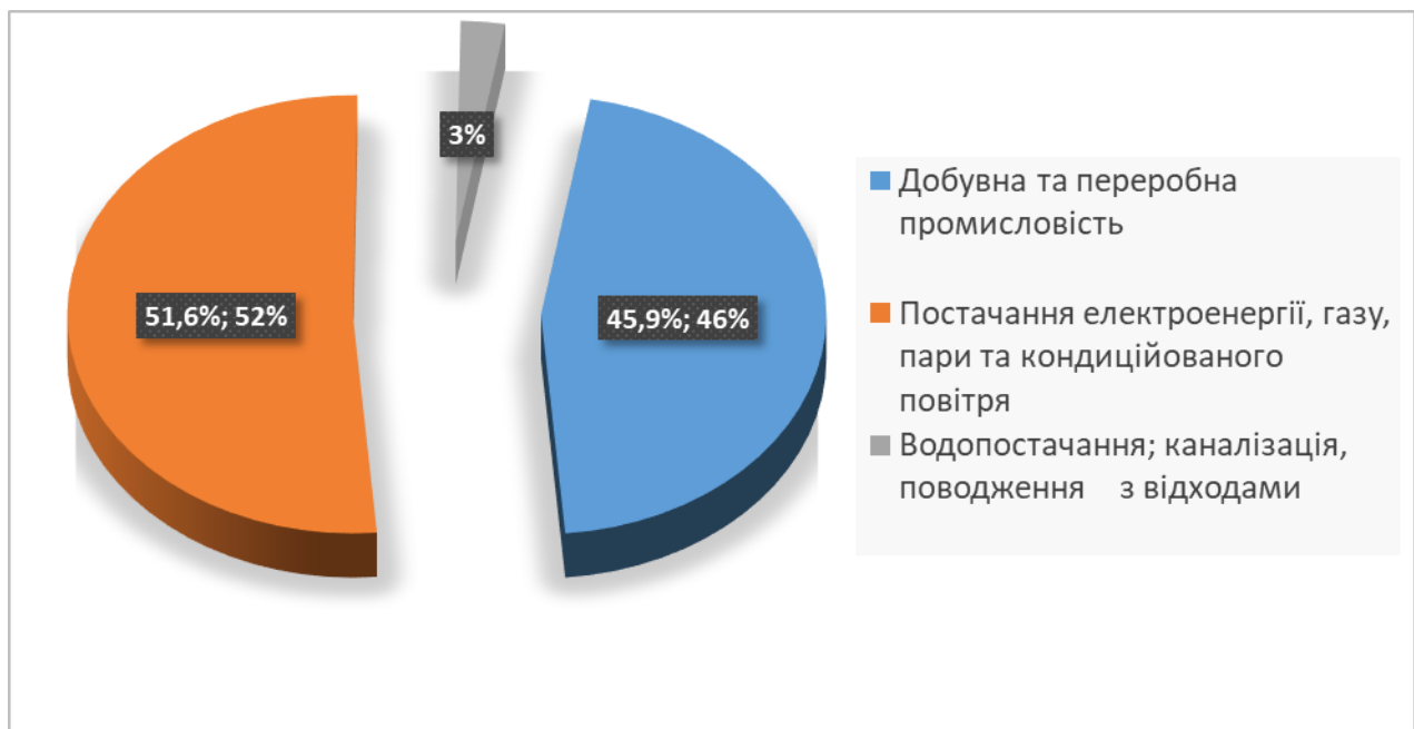
Структура обсягів реалізації промислової продукції

Частка обсягів реалізації підприємств переробної промисловості становить 45,8% в загальному обсязі реалізації. Найбільшу питому вагу у структурі реалізації займали підприємства з постачання електроенергії, газу, пари та кондиційованого повітря (51,6%).