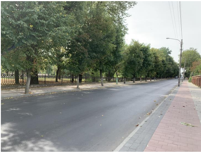
Вул. Г. Мазепи (I-а черга) після капітального ремонту

Значну увагу в 2019 році Департаментом було приділено напрацюванню проектно-кошторисної документації на капітальний ремонт вулиць міста на 2020 рік. Так, на замовлення Департаменту було виготовлено ПКД на «Капітальний ремонт вул. Івана-Павла II», «Капітальний ремонт вул. Крушельницької», «Капітальний ремонт вул. Петрушевича», «Капітальний ремонт вул. Курбаса», «Організацію дорожнього руху на кільцевій розв'язці Г. Мазепи - Довженка - Крихівецька - Набережної ім. В. Стефаніка».