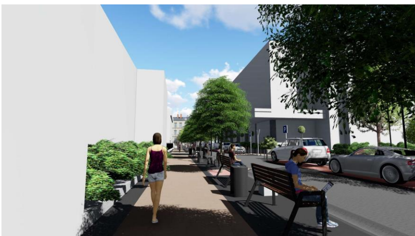
Візуалізація проекту капітального ремонту вул. Петрушевича