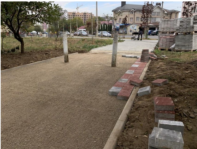
Початок робіт з капітального ремонту скверу на вул. Симоненка, 26, 30,34.