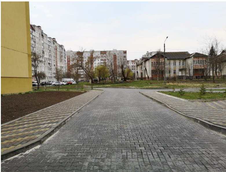
Капітально відремонтовані міжбудинкові проїзди на вул. І. Павла II, 28-30 - Івасюка, 28-30