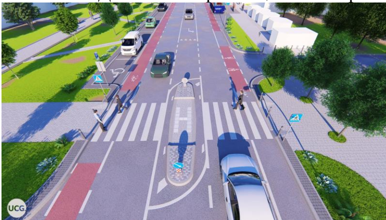
Візуалізація проекту капітального ремонту вул. Івана-Павла II

Значну увагу в 2019 році Департаментом було приділено напрацюванню проектно-кошторисної документації на капітальний ремонт вулиць міста на 2020 рік. Так, на замовлення Департаменту було виготовлено ПКД на «Капітальний ремонт вул. Івана-Павла II», «Капітальний ремонт вул. Крушельницької», «Капітальний ремонт вул. Петрушевича», «Капітальний ремонт вул. Курбаса», «Організацію дорожнього руху на кільцевій розв'язці Г. Мазепи - Довженка - Крихівецька - Набережної ім. В. Стефаніка».