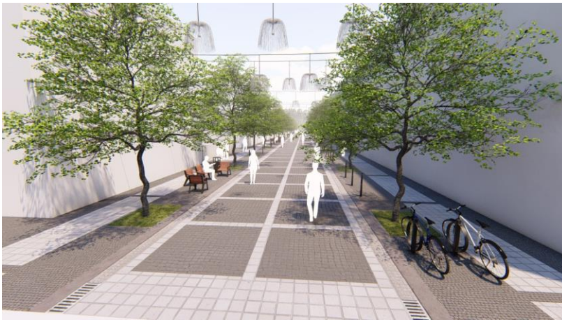
Візуалізація проекту капітального ремонту вул. Курбаса