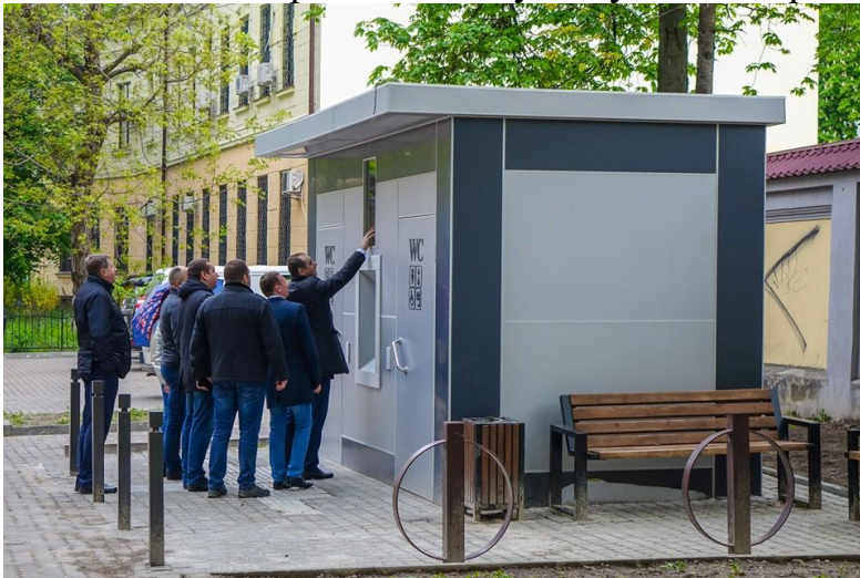
Громадська вбиральня на вул. Валовій

Важливим напрямком діяльності у 2019 році стало виконання «Програми розвитку мережі громадських вбиралень в м. Івано-Франківську», яка спрямована на вирішення проблеми забезпечення мешканців та гостей міста, в тому числі мало мобільних груп населення, громадськими туалетами. Для виконання поставленої мети: забезпечення населення міста необхідними санітарно-гігієнічними вимогами, створення належних умов перебування мешканців та гостей міста в історико-архітектурному центрі міста, - у 2019 році завершено роботи з влаштування модульної громадської вбиральні на вулиці Валовій (поруч управління земельних відносин). Вбиральня пристосована для людей з особливими потребами. Також вона містить довідкову інформацію з використанням шрифту Брайля. Обидві кабіни обладнані кнопками екстреного виклику, на випадок якщо комусь стане погано. Окрім звичних зручностей у вбиральні також є пеленальний столик для немовлят. Приміщення туалету має батареї обігріву.